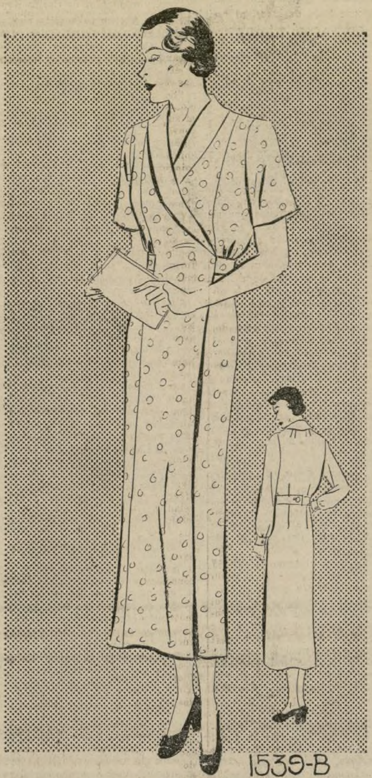
VESTIDO-DELANTEL DE CASA

1539-B. — El vestido de casa nos viene, este invierno, en una gran variedad de estilos, uno de ellos el que presentamos en el croquis de hoy. Este modelo posee en evidencia el progreso de estilo, corte y combinaciones de colores. Estos vestidos son tan fáciles de ejecutar que cualquier dama se deleitará en hacer varios de un mismo patrón.