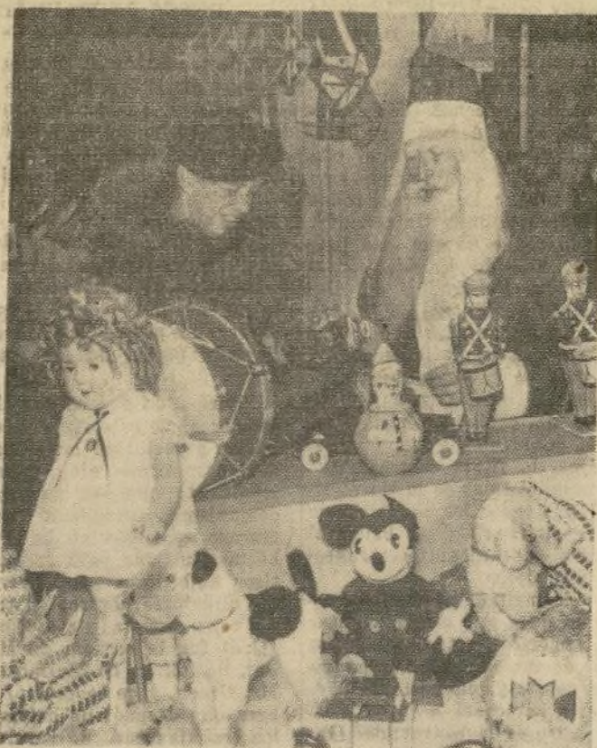
La esposa del presidente de los Estados Unidos, inspecciona el departamento de juguetes de un bazar de la capital donde hizo varias compras para sus nietecitos y otros niños, con motivo de las próximas fiestas.