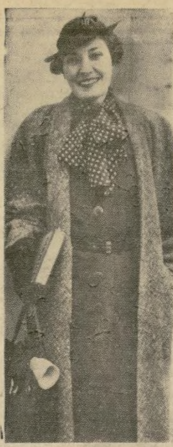
Mrs. Harrison Williams, de Nueva York, sonríe al tener noticia de que según la lista formada por los modistos de París ella es considerada la mujer mejor vestida del mundo. La segunda de la lista es también otra americana, Louise Van Allen, esposa divorciada de Alexis Mdivani, hoy marido de Barbara Hutton.