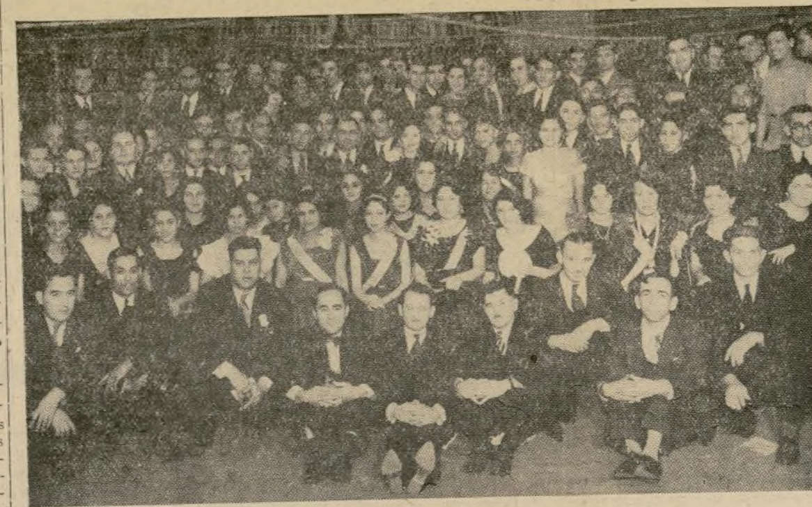
Un lucido grupo de socios y simpatizadores de esta organización puertorriqueña se reunió el sábado para participar en el baile que había organizado, y quedaron muy complacidos, tanto de las atenciones recibidas de los directivos como de la agradable velada, cuyo baile duró hasta pasado la una de la madrugada, en el Spartacus Club.