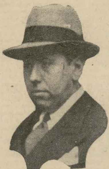
Sr. Gil Robles

jefe de Acción Popular declaró que continuará su alianza con los radicales. -- Dijo que su partido sólo desea gobernar dentro de la ley. -- Propone la reforma del Tribunal Supremo.