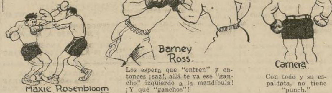
Barney Ross Los espera que "entren" y entonces ¡saz!, allá te va ese "gancho" izquierdo a la mandíbula! ¡Y qué "ganchos"! Carnera Con todo y su espaldita, no tiene "punch."

Los "uppers" de McGovern al plexo solar tenían una efectividad tremenda.