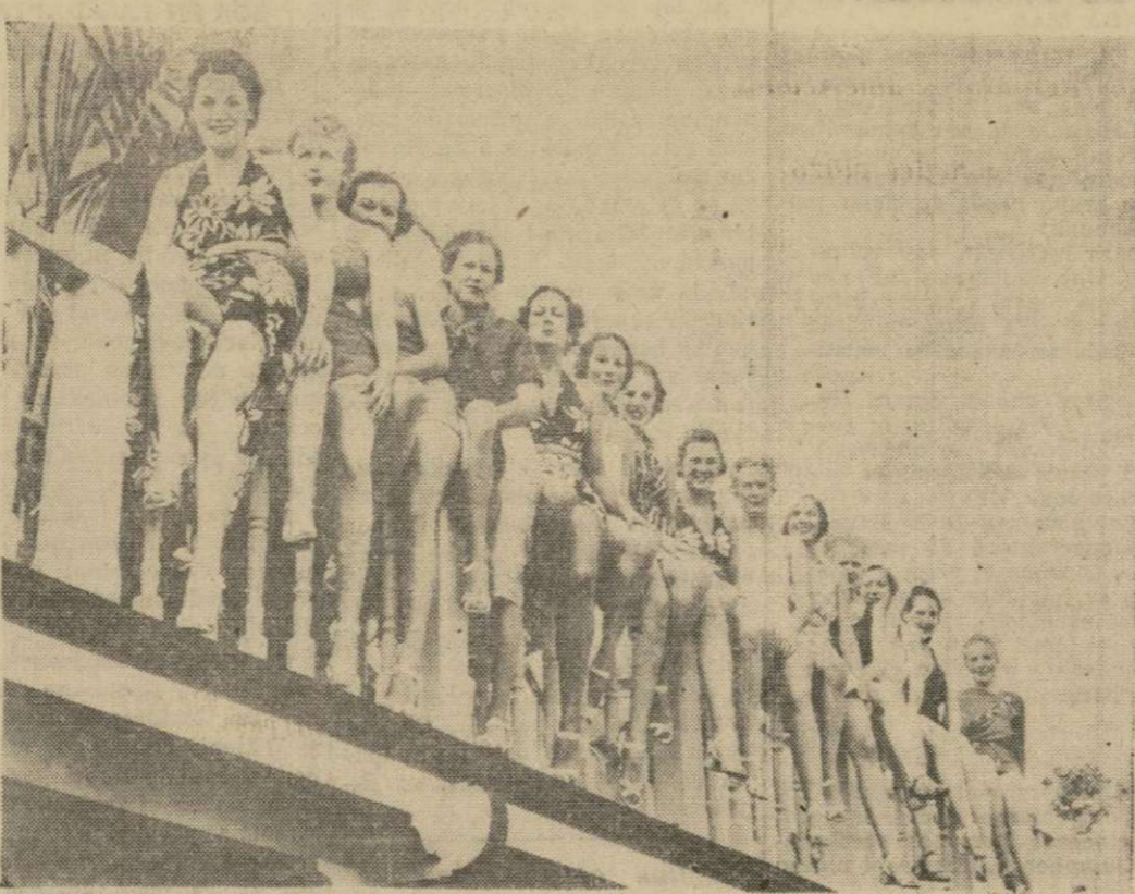
Grupo de primeras visitantes al Sur Club en las playas de Miami, que muestran la variedad de nuevos diseños que se usarán en los trajes de baño en la temporada de 1935, los cuales van desde el "cellophane" y la seda hasta las más recientes y pintorescas adaptaciones de los trajes de las mujeres tahitianas.