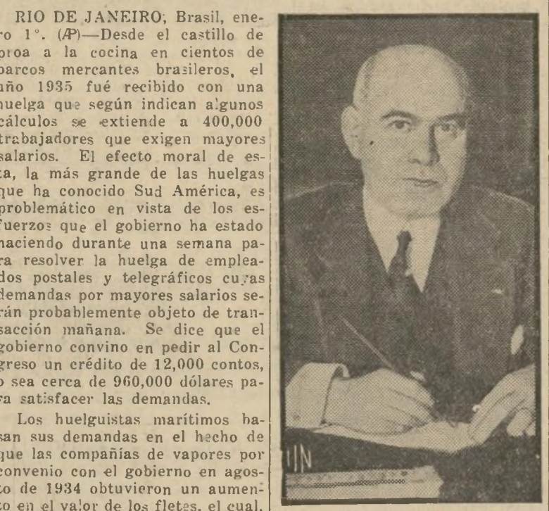
Gobernador Herbert H. Lehman

Se cree que la huelga puede extenderse a 400,000 trabajadores que exigen mayor salario.—Sería la mayor que ha conocido Sud América.