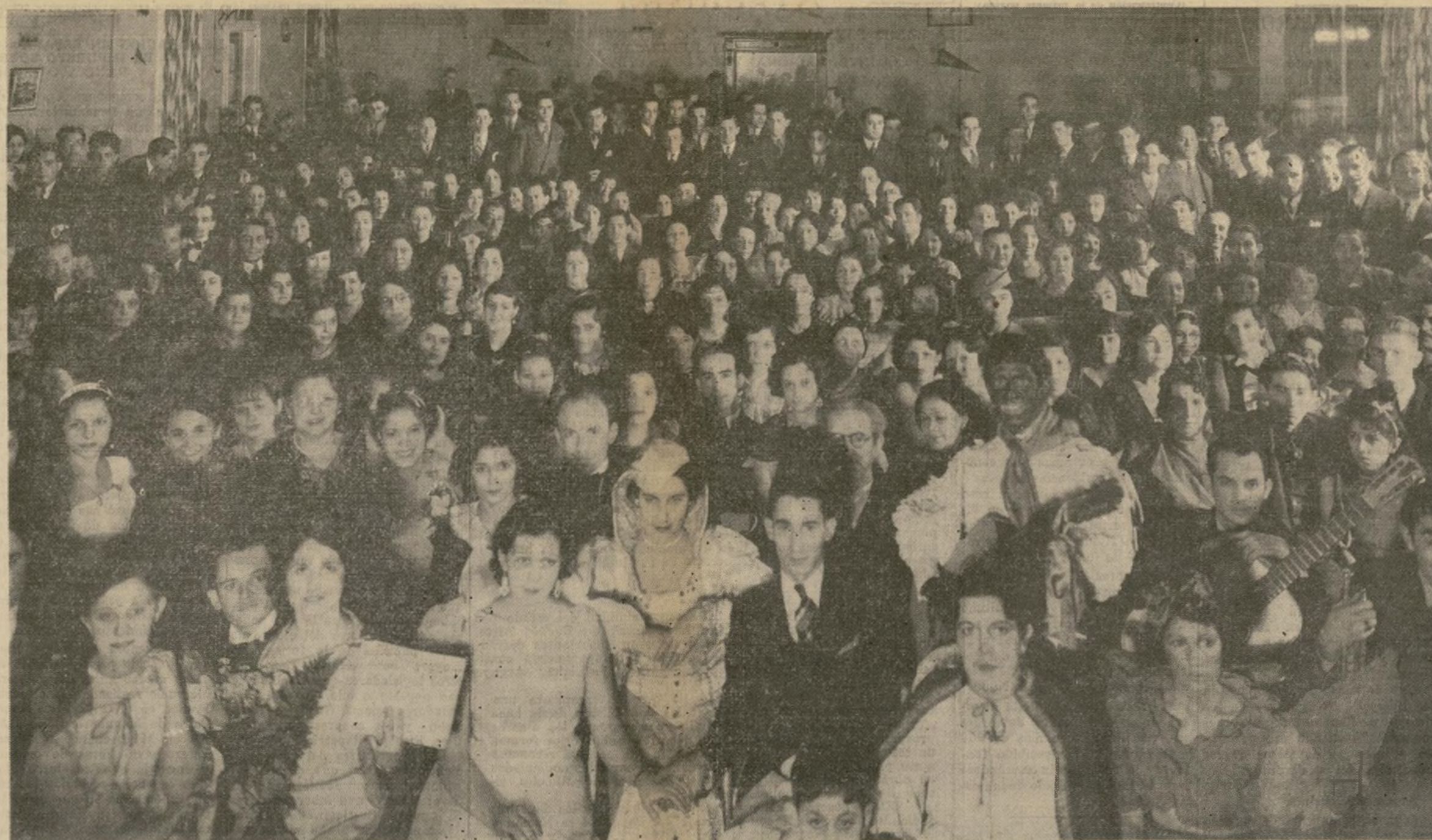
De función teatral y baile consistió el festival dado por este Club el sábado en su salón social, y congregó una numerosa concurrencia integrada por conocidos

elementos hispanos que asiduamente patrocinan sus actos. La función dejó satisfechos a los asistentes que disfrutaron agradables horas, y el baile se