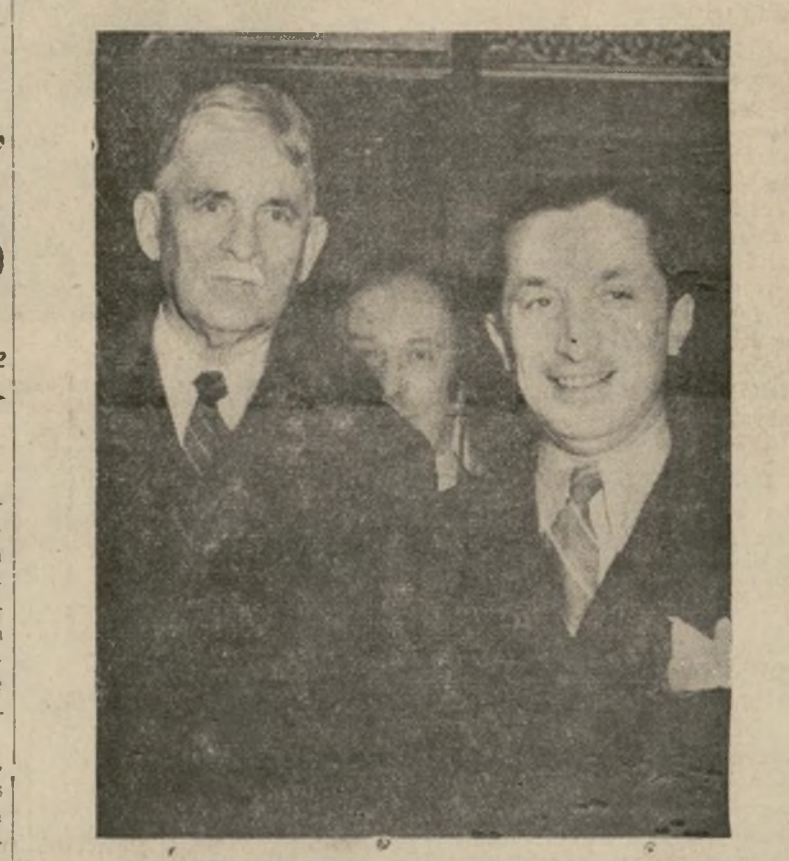
El doctor John F. Condon, intermediario del coronel Lindbergh que pagó los $50,000 del rescate al misterioso "John" en el Cementerio de St. Raymond, se halla en Flemington esperando que llegue el turno para declarar en el juicio del Estado contra Bruno Richard Hauptmann, acusado del secuestro y muerte del niño. A la derecha el procurador general David T. Wilentz.

El aya contesta con gran firmeza las preguntas del defensor. — Cuatro nuevos nombres aparecen en el juicio. — Ausencia absoluta de impresiones digitales en la habitación. — La escalera fué presentada al tribunal.