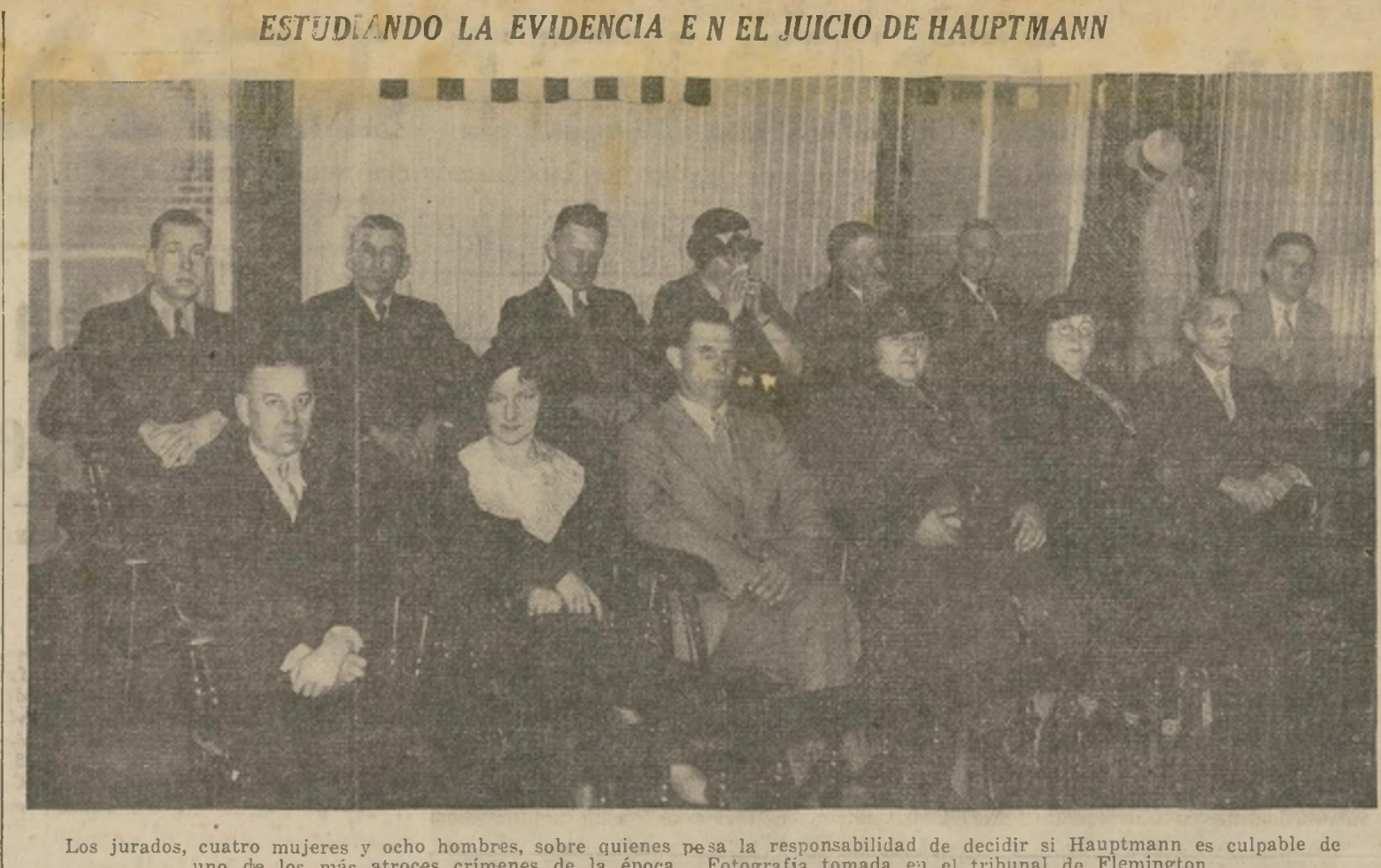
Los jurados, cuatro mujeres y ocho hombres, sobre quienes pesa la responsabilidad de decidir si Hauptmann es culpable de uno de los más atroces crímenes de la época. Fotografía tomada en el tribunal de Flemington.

Dijo además que un proyecto parecido a lo que él propone había estado ante el comité que él preside en el congreso y éste había sido puesto a un lado en espera de que el comité investigador rindiera su informe.