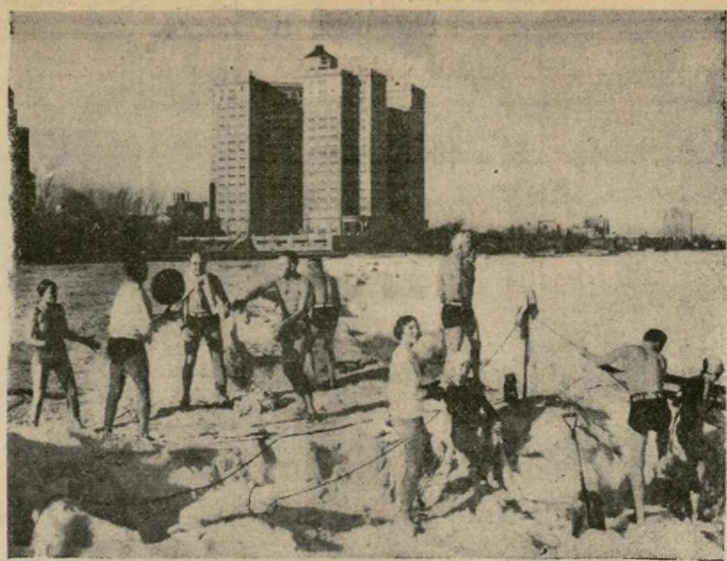
Miembros de la organización esperan que lleguen los demás compañeros para echar su nadada semanal en las heladas aguas del Lago Michigan, y mientras tanto calientan el cuerpo jugando con la bola sobre el hielo en la playa de Edgewater.