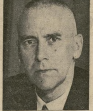
Wilhelm Frick, ministro del Interior de Alemania listo para absorber el territorio dentro de un mes, pagando a Francia $59,000,000 por las minas de hulla.