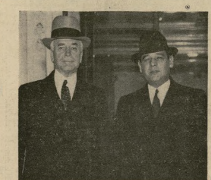
El general Abelardo Rodríguez (derecha), sale de la Casa Blanca acompañado del Secretario de Estado, Cordell Hull, después de un almuerzo dado en su honor por el Presidente Roosevelt.