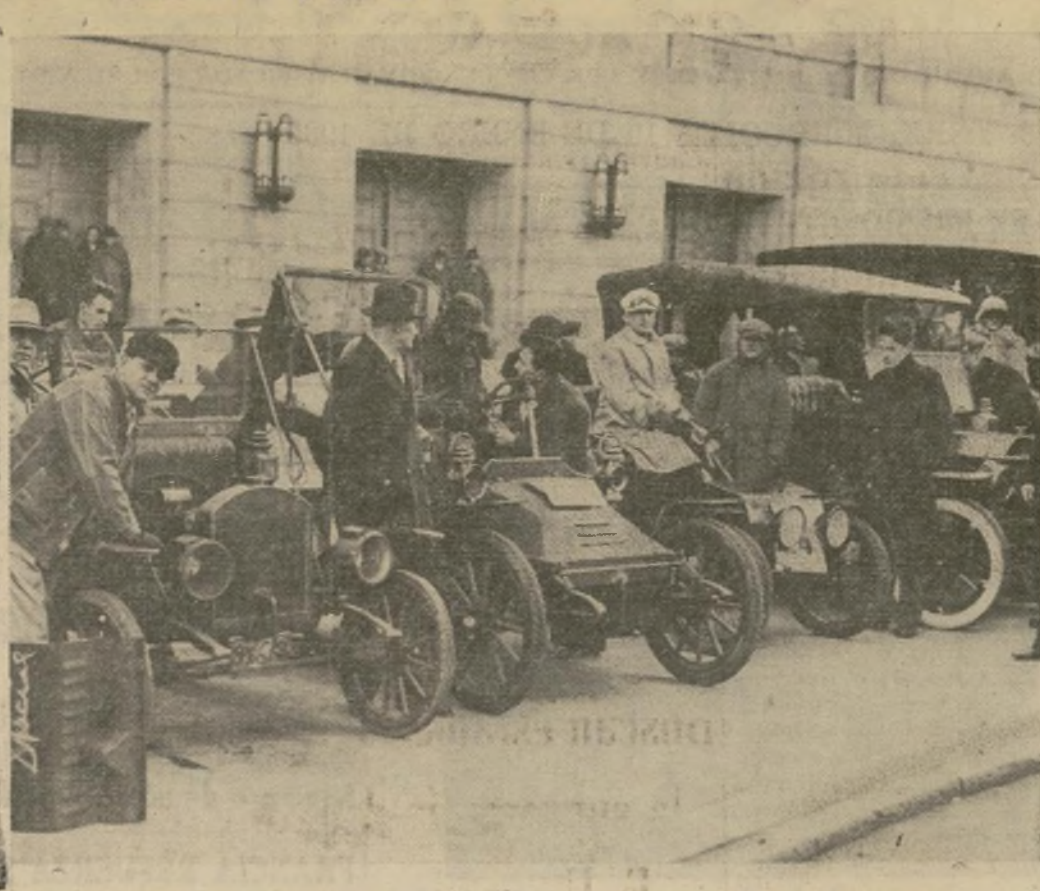
Estos vejeteros fabricados hace treinta años están siendo aquí examinados por sus conductores en espera de la señal de partida, antes de lanzarse a bulliciosa y "veloz" carrera en el derby automovilístico anual corrido en Filadelfia.