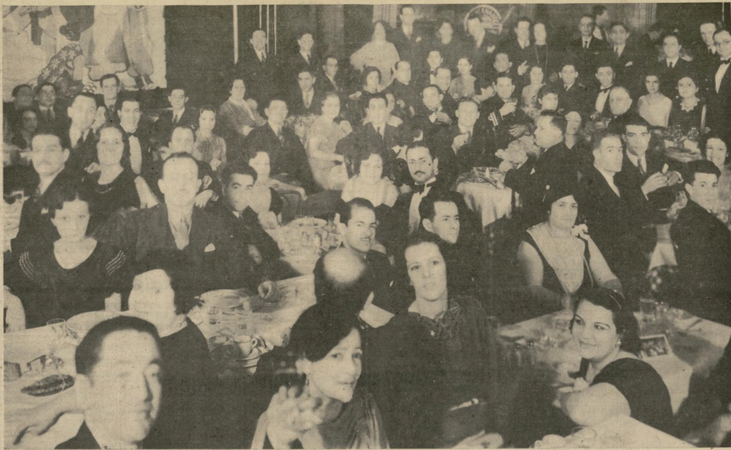
Vista parcial de la numerosa concurrencia al banquete y baile a la oficialidad del transporte colombiano de guerra "Cúcuta" celebrados la noche del sábado en

el "Café Internacional" de esta ciudad. Reinó gran animación en todo momento y se bailó hasta avanzada hora de la madrugada. El festejo a los oficiales del