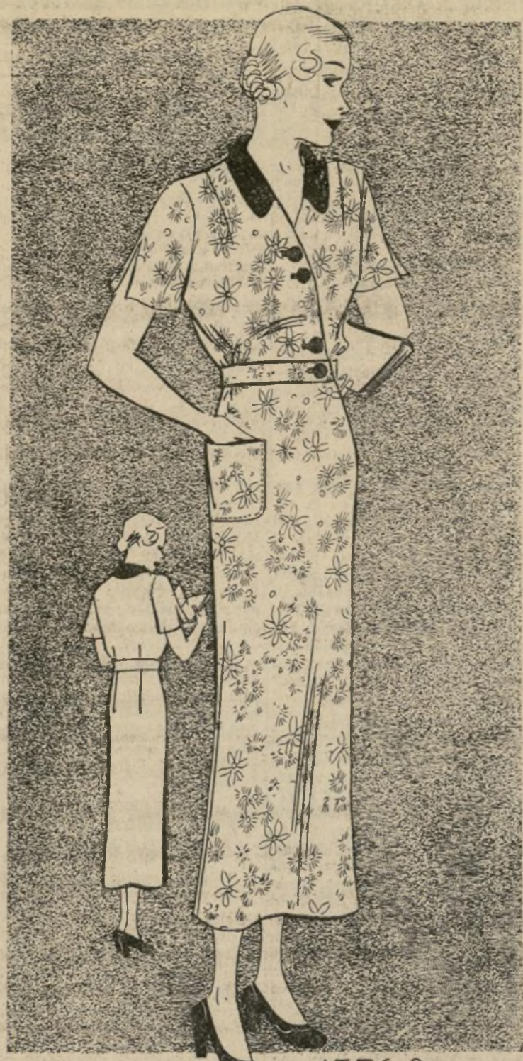
ELEGANTE VESTIDO DE CASA PARA DAMA ALGO GRUESA

Añade un poquito de añil al agua enjabonada de lavar los va- sos y quedarán muy limpios y bri- llantes.