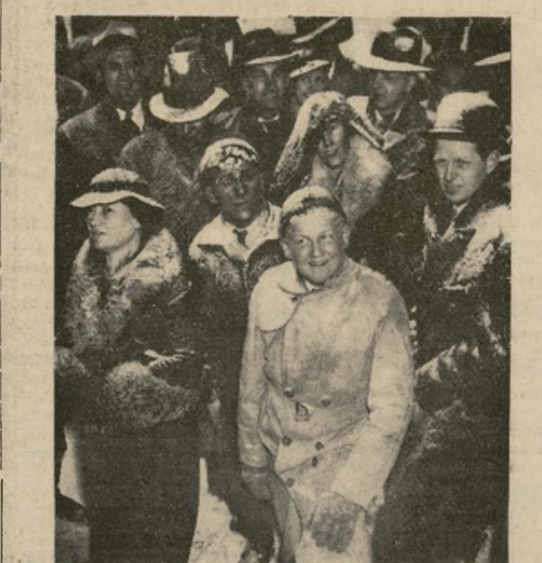
A pesar de la nevada, la acostumbrada multitud, tal vez mayor ayer, espera turno pacientemente para entrar al tribunal de Flemington, donde se juzga a Bruno Richard Hauptmann.