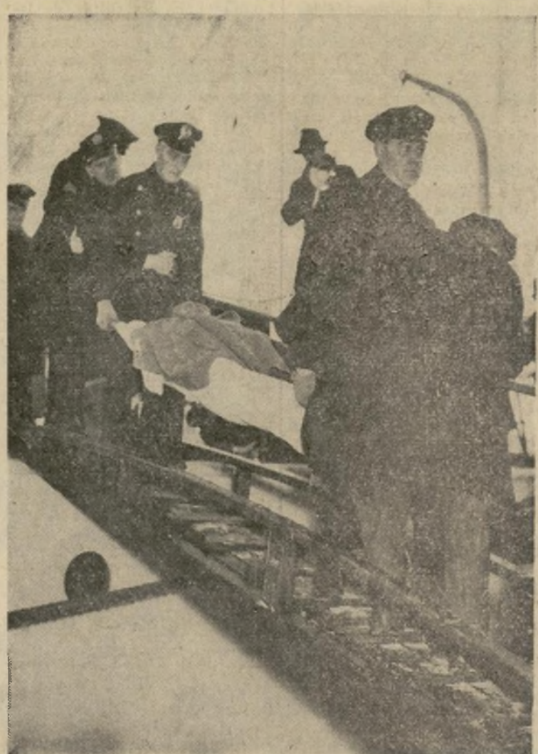
Policías de Nueva York desembarcando del guardacostas "Champlain" a uno de los tripulantes heridos en el choque que echó a pique al buque "Mohawk" a la altura de Sea Girt, New Jersey.