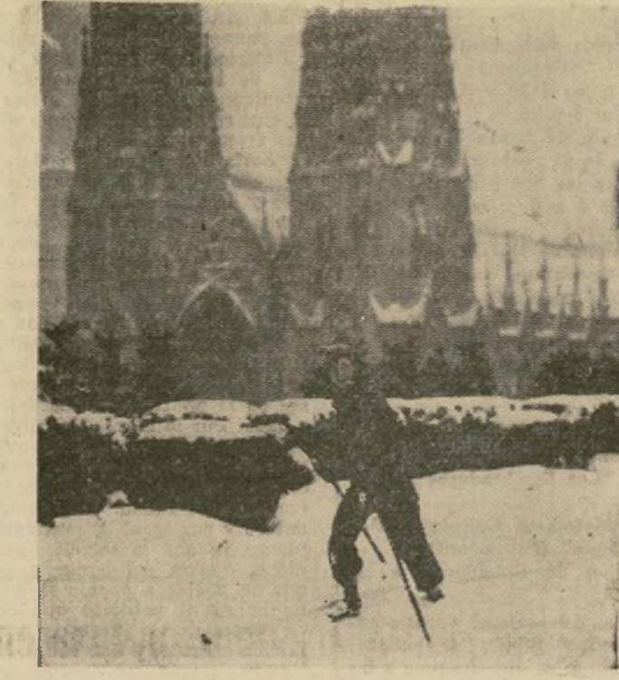
Un entusiasta esquiador practica en la azotea de uno de los edificios del Centro Rockefeller, en el corazón de Nueva York, durante lo más fuerte de la nevada. En el fondo se ven las torres de la Catedral de San Patricio.