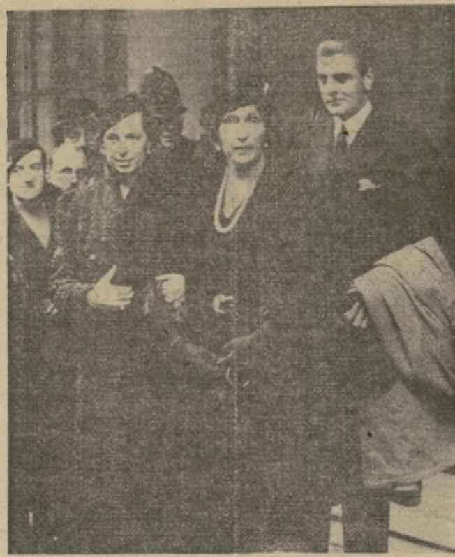
Doña Victoria Eugenia de Battenberg, que fue reina de España, al reunirse con su hija, doña Beatriz y con el esposo de ésta, Príncipe Alessandro Torlonia.