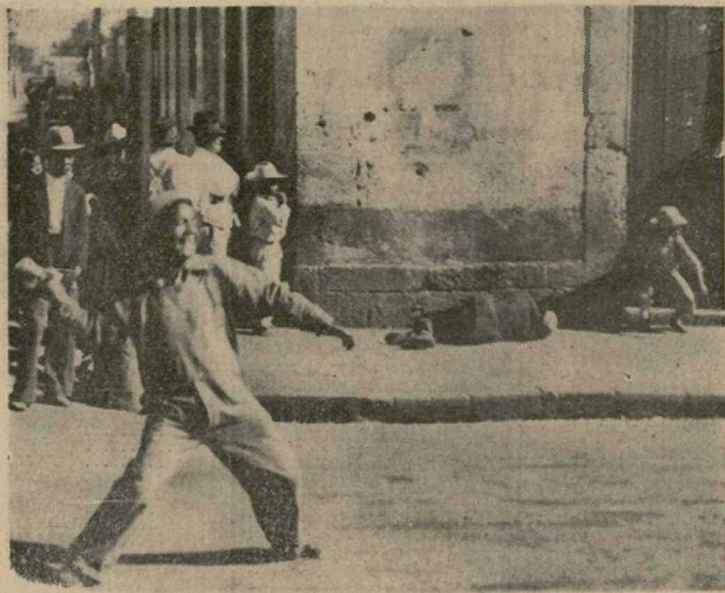
Un "chamaco" lanza una pedrada durante un disturbio en la Villa de Guadalupe, cerca de la famosa iglesia de la patrona de Méjico, ocurrido cuando la policía trataba de dispersar a un grupo de católicos. El sujeto de policía resultó herido.