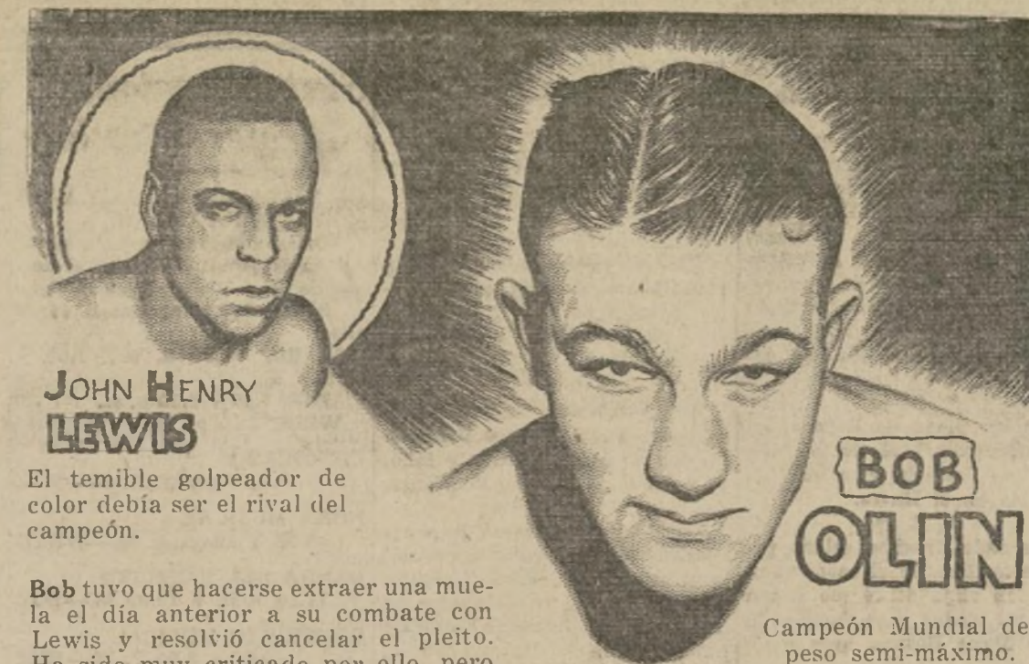
Campeón Mundial del peso semi-máximo.