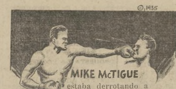
estaba derrotando a