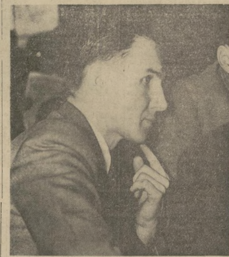
Bruno Richard Hauptmann listo para su tercer día de testimonio, que terminó ayer al dar el procurador David T. Wilentz por concluido su examen del acusado.

Terminó ayer el interrogatorio del acusado por el fiscal. Sin embargo, Wilentz logra hacer repetir a Bruno, inconscientemente por parte de éste, una frase contenida casi idénticamente en dos de los mensajes del rescate.