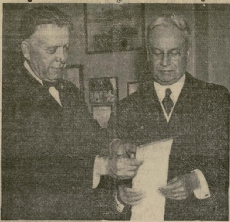
Los senadores William E. Borah (izquierda) y Hiram Johnson, una vez anunciado el resultado de la votación que se tomará en el Senado sobre si Estados Unidos iba a formar parte o no de la Corte Internacional. Estos fueron dos de los más fuertes opositores.