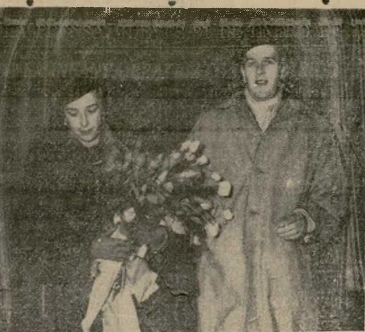
La hija mayor de Don Alfonso de Borbón y su esposo, el Príncipe Alejandro Turlonia, al desembarcar del vapor "Aquitania" en Nueva York, donde pasarán una temporada, con la madre del novio, en viaje de luna de miel.