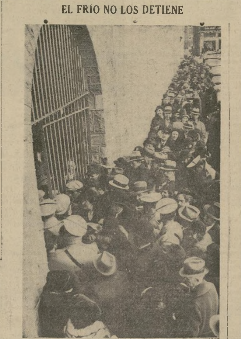
Multitud de curiosos se apiñan a pesar de la temperatura de cero tratando de entrar al tribunal de Flemington después que el magistrado Trenchard ordenó que no se permitieran espectadores de pie en el recinto.

Sentado a la primera mesa estaba Hauptmann, según el testigo, leyendo periódicos, a quien (sigue en la sexta página)