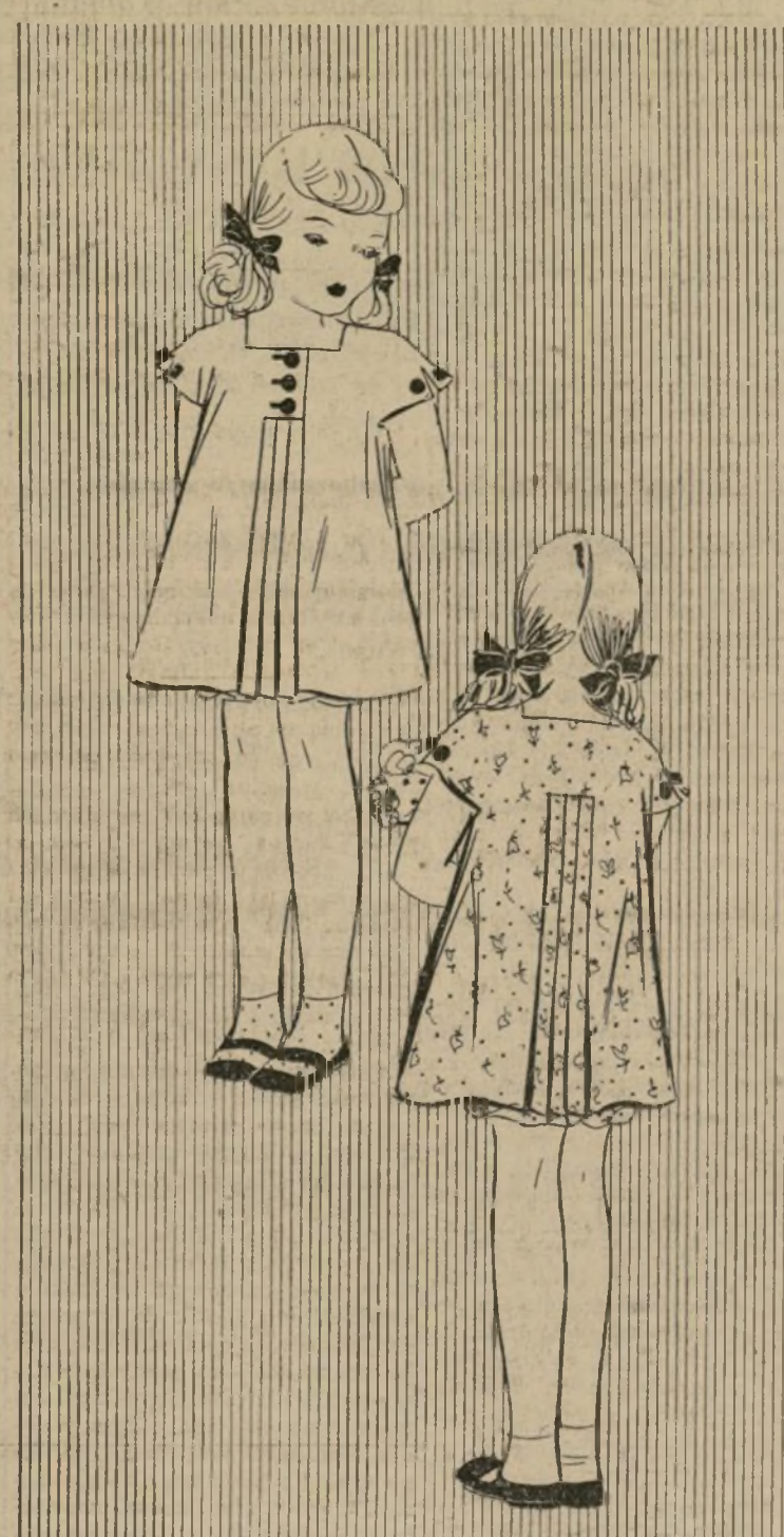
ENCANTADOR VESTIDO PARA NIÑAS DE 2 A 6 AÑOS

La duodécima página La duodécima página de la vida es la más importante.