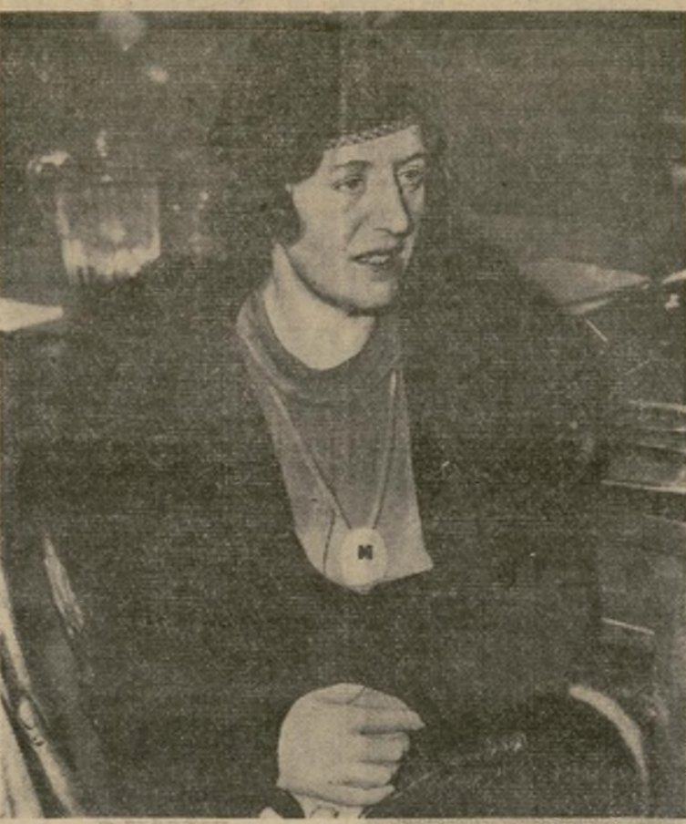
La leal esposa del acusado, que declaró en el tribunal que la noche del secuestro su marido estaba con ella en la panadería del Bronx donde trabajaba.