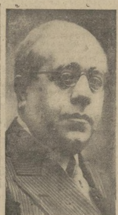
Don Manuel Azana

La revolución uruguaya a punto de sucumbir