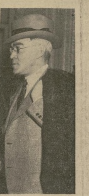
Donald R. Richberg, director del Consejo de Emergencia Nacional, de ser un "traidor del trabajo organizado en Estados Unidos." Con él aparece Earl Houck, abogado de la Unión.

La A.F.L. se dispone a atacar el código de automóviles en el Congreso de E. U.