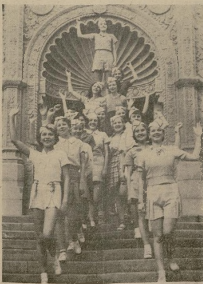
Muchachos escolares que han formado un cuerpo uniforme para tomar parte en las festividades cívicas que precederán a la inauguración de la Exposición Internacional del Pacífico, en San Diego.