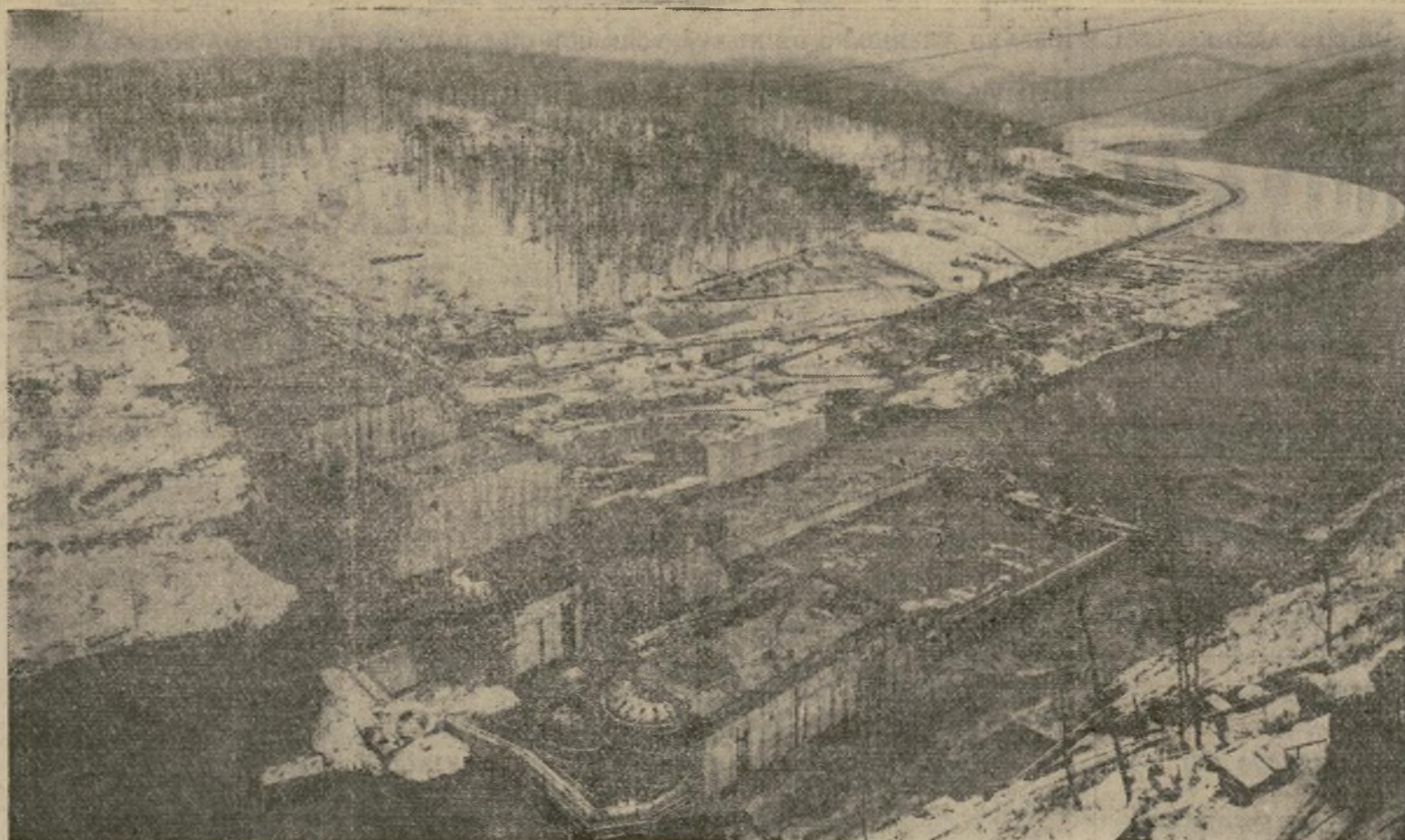
Vista aérea de la presa Norris, en donde, a pesar del intenso frío, continúa vertiéndose el concreto, usándose agua caliente en las mezcladoras. Fogatas de coque, encendidas en braseros colocados debajo de lonas alquitranadas impide que se congele la mezcla de concreto recién vertida.