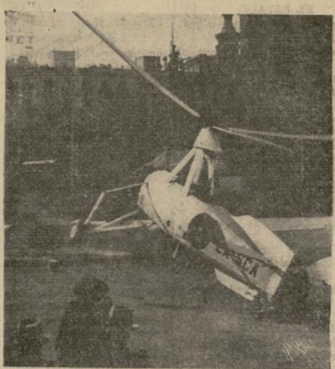
Un autogiro, piloteado por un teniente del ejército español, al elevarse desde una plaza llena de gente en el centro de Barcelona, después de haber hecho allí un feliz aterrizaje, unos cuantos segundos después de volar al suelo y dejar al oficial gravemente herido.

El Pdte. Roosevelt conferenció con líderes obreros