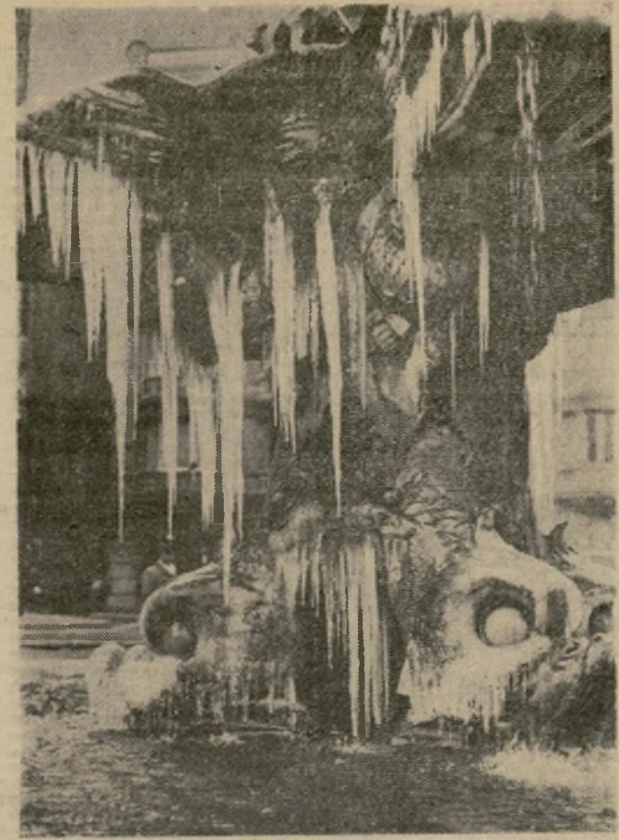
La Fuente de los Tritones en Roma, después de la primera nevada caída en la ciudad desde hacía mucho tiempo. La cual fué motivo de una extraordinaria diversión para los chicos de la capital italiana.