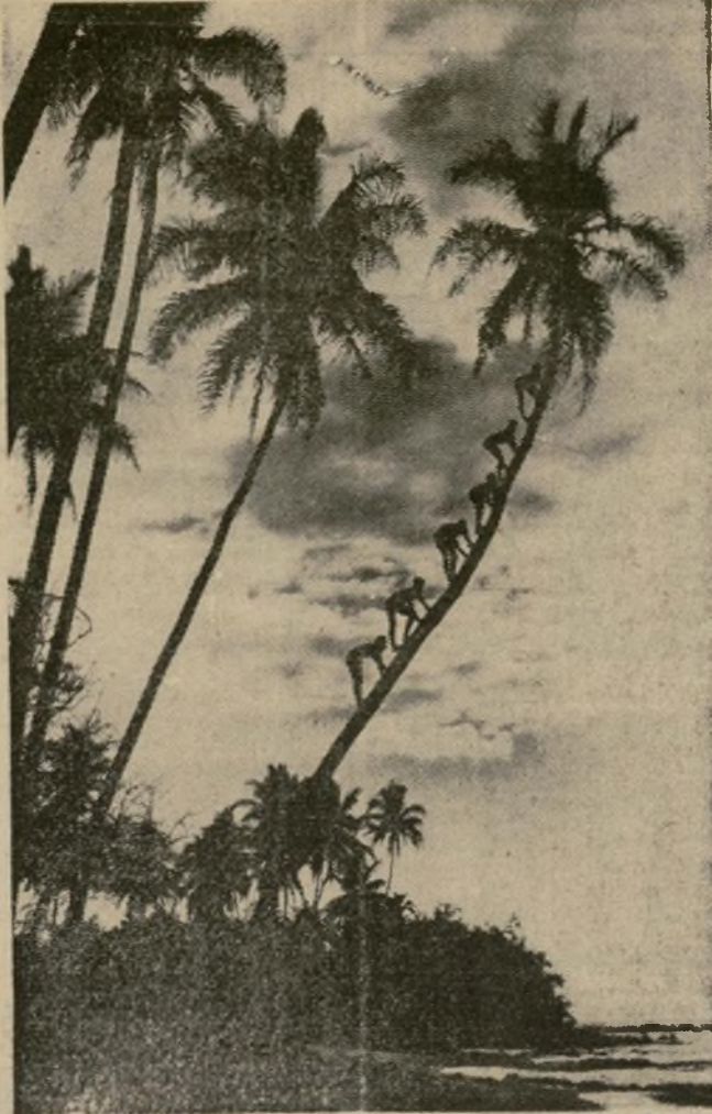
Estos bañistas con aspecto de monos, que huyendo a los rigores del Norte han ido a pasar una temporada en los climas más benignos del Sur semi tropical, tratan de alcanzar la copa de la palmera con el objeto de que ella incline su tronco y ellos puedan lanzarse al agua.