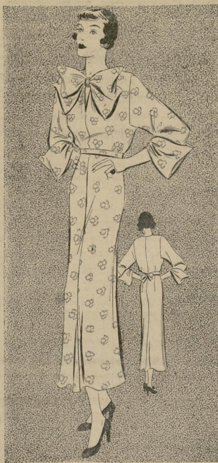
1591-B VESTIDO DE SEDA ESTAMPADA

1591-B.—Ningún guardarropa estará completo sin uno o dos vestidos de semi-etiqueta como el que ilustramos en el grabado de hoy. El lazo mariposa es el detalle más sobresaliente del traje. Este adorno es tan necesario en este modelo como las solapas en un traje de chaqueta. Ambos cuentan a más anchos más bonitos resultan, particularmente sobre una falda de silueta angosta. Se están notando variaciones en la silueta de los modelos más nuevos. Por ejemplo la falda de hoy es algo acompañada y de estilo muy juvenil. La manga "dohman" es muy digna de admirar. Las costuras del vestido son de corte muy gracioso y elegante. Para la confección del diseño de hoy hay una selección muy variada de sedas estampadas y tejidos sintéticos. La tafeta estampada es algo muy nuevo, así como las siguientes telas: crepón, crepé y satén. Los estampados de motas y rayas se apropian más para vestidos de sport, mientras que los florados para los de semi-etiqueta. Este patrón se puede conseguir en los tamaños siguientes: 12, 14, 16, 18 y 20. Correspondientes a los 30, 32, 34, 36, 38, 40 y 42. El costo de este patrón es de $20. Solamente en los tamaños especificados. Al ordenar cualquiera de estos patrones, sírvase dar claramente la medida exacta que se desea.