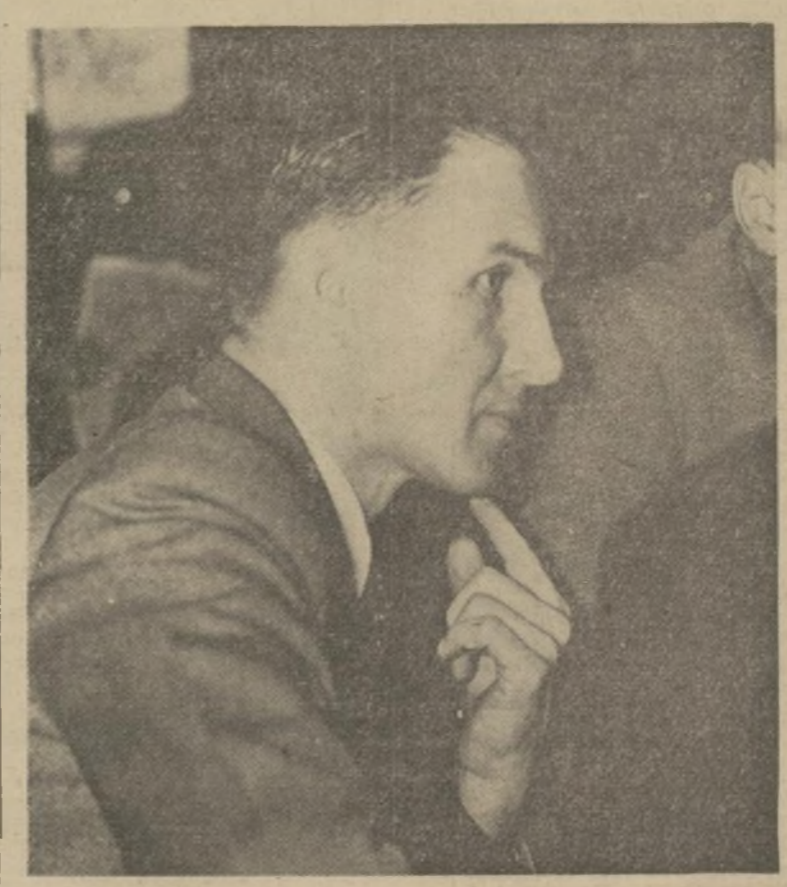
BRUNO RICHARD HAUPTMANN