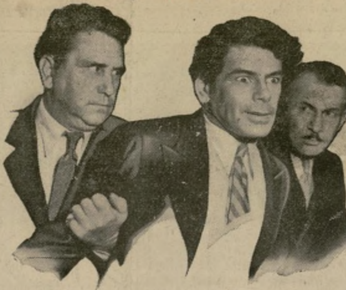
Una escena sumamente emocionante de la película "Bordertown" en la cual aparece Paul Muni. Paul acaba de atacar a un abogado contrario en la Corte de Justicia y las garras de la autoridad caen sobre él en impetuoso gesto de dominio. Esta película se presenta en los teatros Regent y Hamilton.