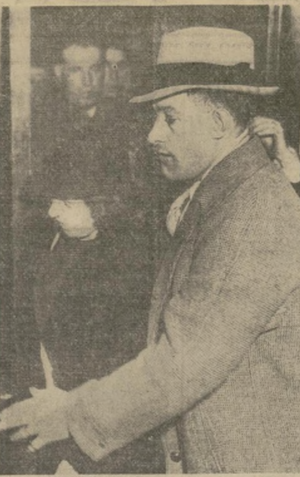
La esposa de Hauptmann abandona la sala de la Corte de Flemington después de oír al jurado dar el veredicto de culpabilidad contra su marido, y al juez pronunciar la sentencia enviando al carpintero a la silla eléctrica.