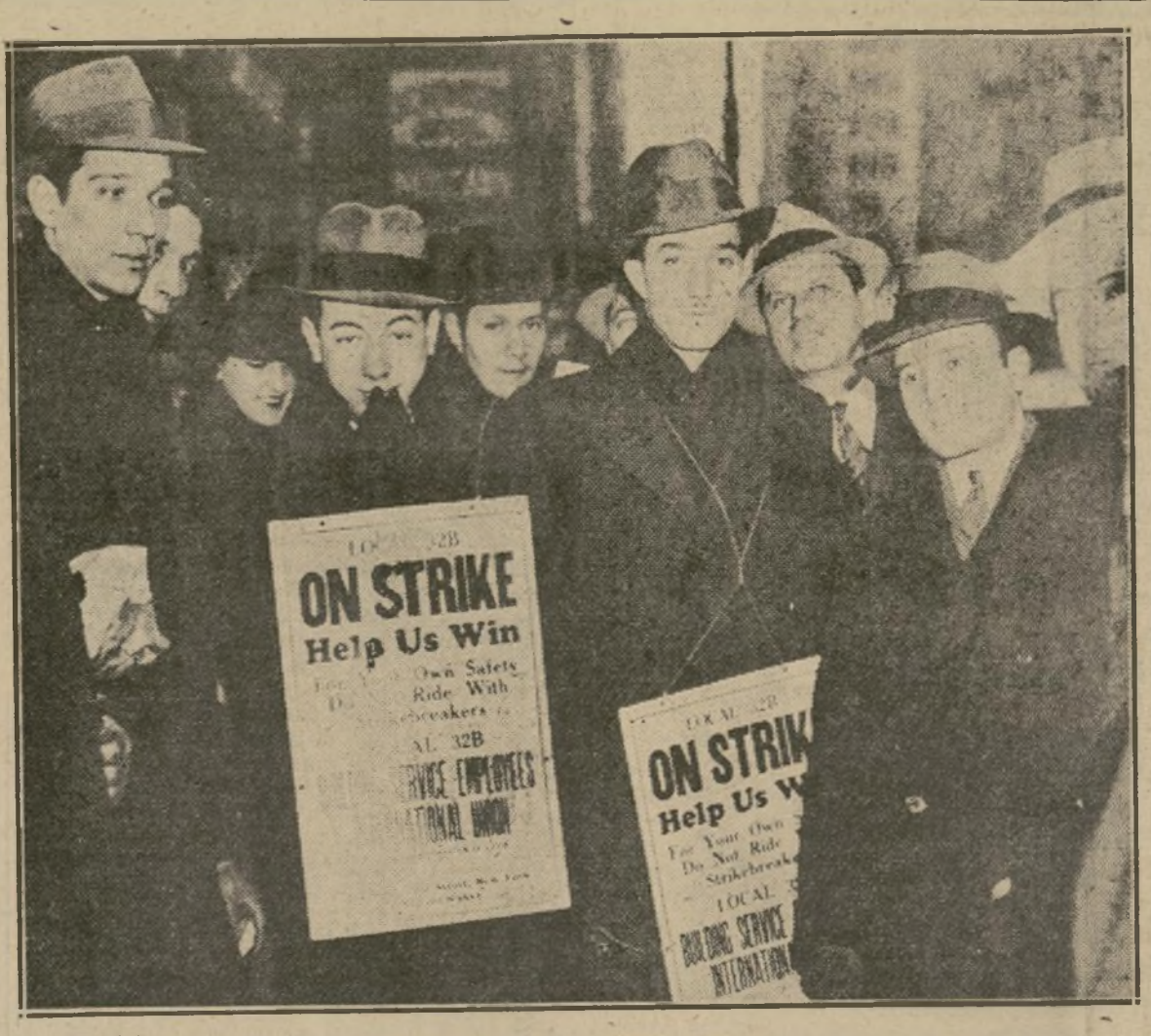
Un típico grupo de "pickets" de la huelga de ascensoristas, prestando servicio ante el edificio Bricken & Bricken, 1385 Broadway, en el día de ayer. La expresión de los huelguistas era una de absoluta fe en su causa y de determinación.