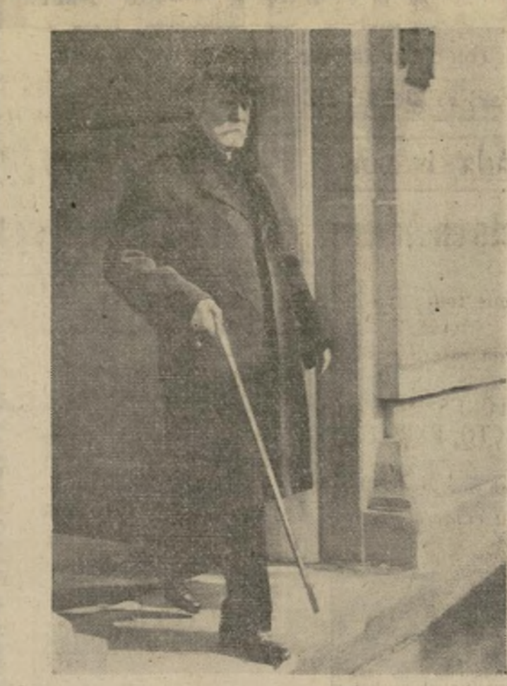
Charles Evans Hughes saliendo de su casa en Washington para la sesión en la cual fue leída la decisión de la Corte Suprema sosteniendo la política del gobierno respecto al oro. La corte estaba dividida en cinco contra cuatro.