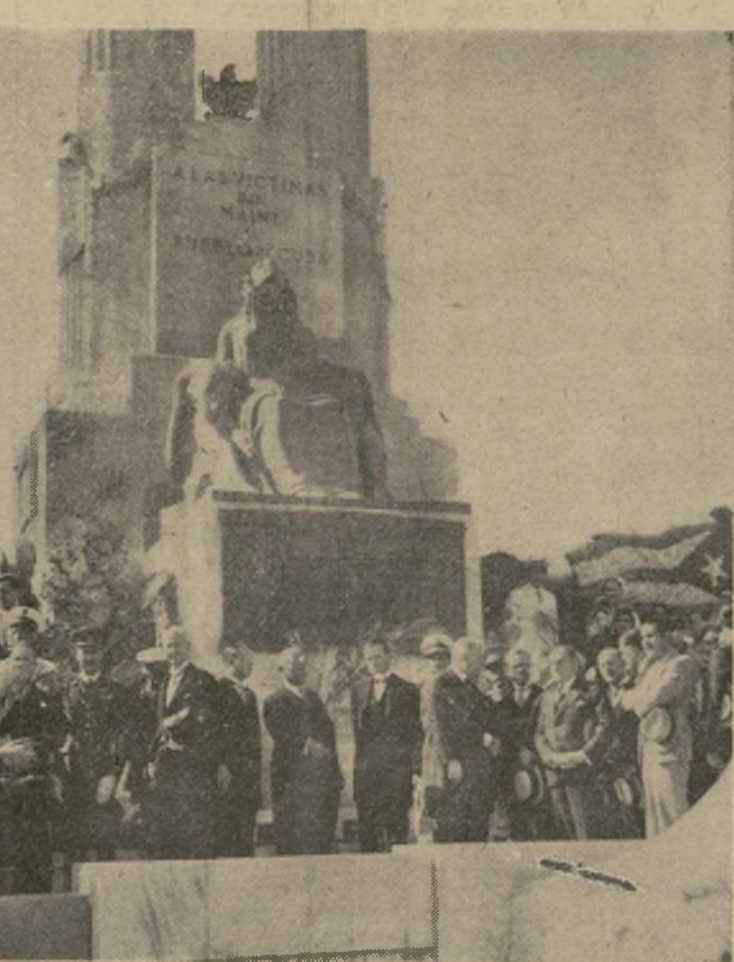
El presidente Mendieta de Cuba (centro izquierda) y el embajador norteamericano Jefferson Caffery, con otros oradores durante las ceremonias al pie del monumento a las víctimas del "Maine" en la Habana en el aniversario del hundimiento de dicho barco.