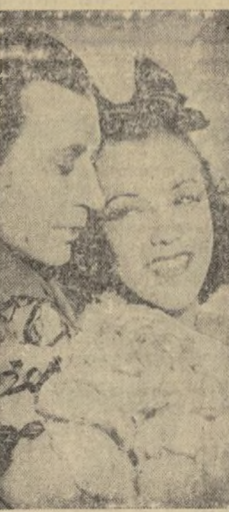
George Raft y Margo, pareja de bailes que aparece en la película "Rumba" que se empieza a exhibir mañana, día de Washington en el Teatro Paramount.

Ambos artistas presentan una interpretación del tradicional baile cubano que titula la obra.