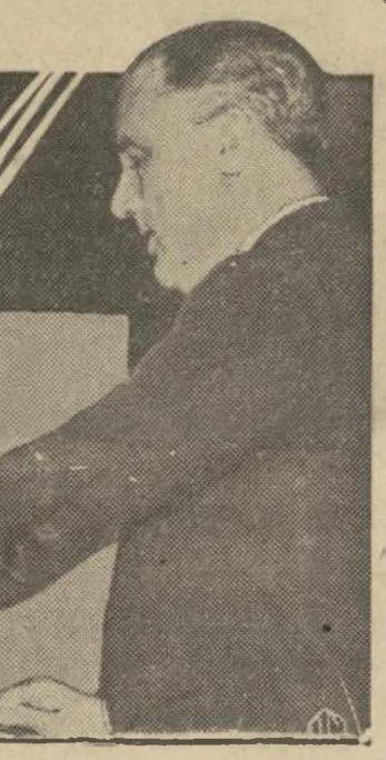
Presidente Franklin D. Roosevelt