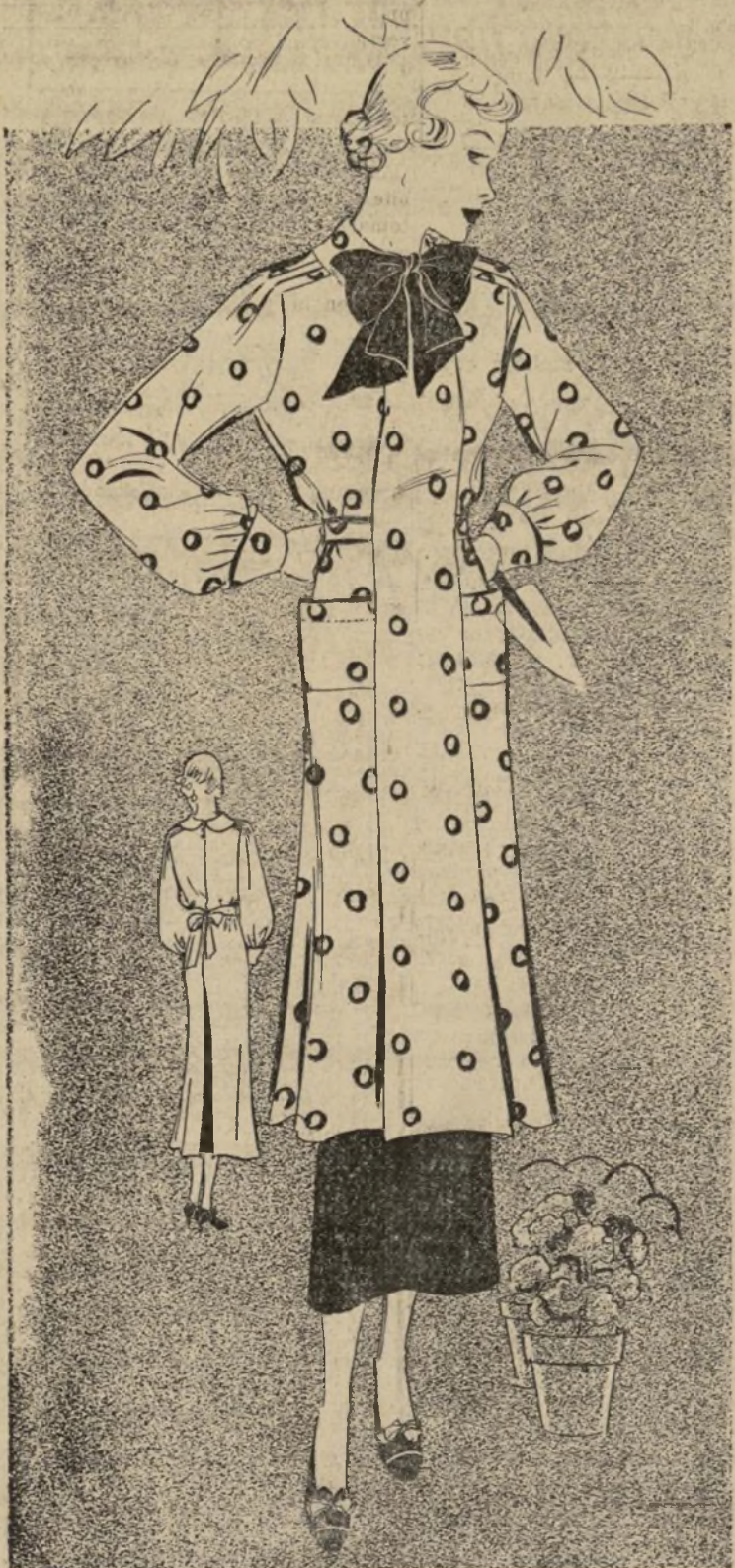
1524-B DELANTAL PROPIO PARA JARDIN

1524-B.—Cuando principia a asomarse el sol de primavera, lo primero que se nos ocurre es un delantal y un jardín. El que ilustramos hoy es monísimo. Es abito de seda y lana mate a cuadros, con un panel gracioso en la delantera formando dos pliegues. El cinturón lo sujeta graciosamente a la figura.