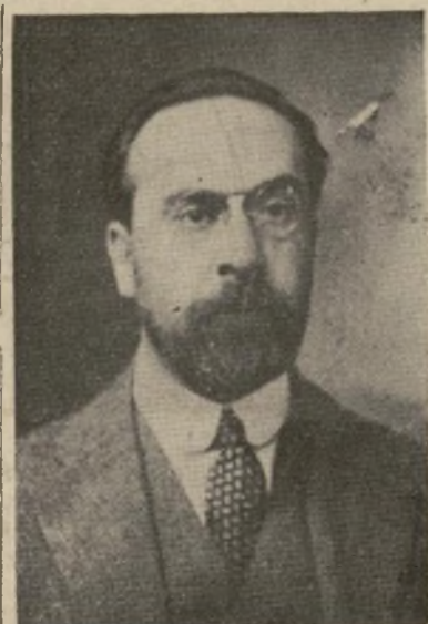
Don Fernando de los Ríos