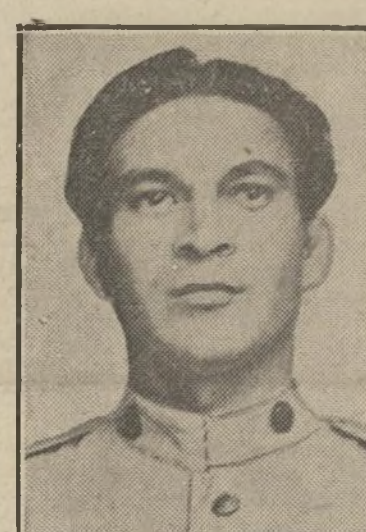
Coronel Fulgencio Batista