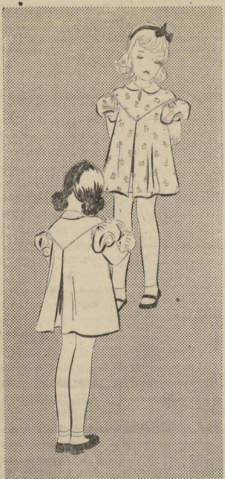
VESTIDO CON PANTALONCITO PARA NIÑA

1538-B—La ropa de la gente menuda cada día es más bonita. Es de carácter completamente nuevo, y muchos modelos reflejados en detalles que predominan en las creaciones de personas mayores. Por ejemplo, las hombreras caídas, mangas abullonadas, escotes altos y las faldas algo acampanadas. En el grabado de hoy presentamos un vestido que reúne los detalles mencionados. Además de ser sencillísimo de confeccionar, el diseño es encantador. Si tiene una niña, no deje de hacerse. El patrón completo se compone de 9 piezas. Incluyamos manga larga y corta. La larga es preferible para usar ahora y durante los días frescos de la primavera.