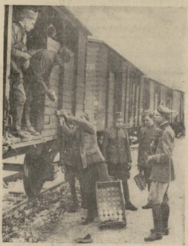
Materiales para el uso de las unidades enviadas a reforzar las guarniciones en las fronteras de Abisinia al ser puestas a bordo de trenes en Roma.