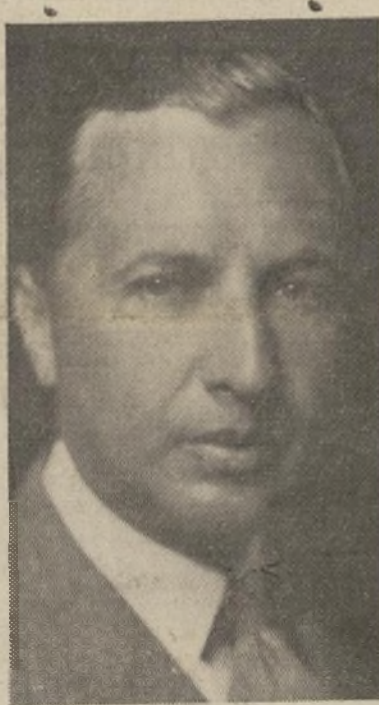
Dr. Miguel López Pumarejo

El nuevo Ministro de Colombia ante el gobierno de los Estados Unidos, doctor Miguel López Pumarejo, hermano del actual ejecutivo nacional colombiano, doctor Alfonso López, se trasladará a Washington, D. C., cuando reciba las instrucciones directas de su gobierno al efecto, animado de los mejores deseos de mantener en pie las excelentes relaciones existentes entre los dos países, y con plena fe en las perspectivas tanto internas como internacionales de su patria.