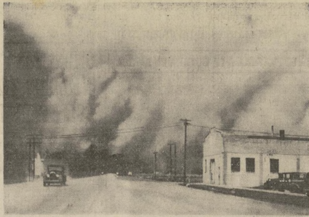
El automóvil que aquí se ve viene entrando a toda velocidad a Scott City, en el estado de Kansas, antes de que lo alcancen las nubes de polvo que lo vienen persiguiendo, llevadas por el viento a más de 56 millas por hora. Poco después de tomarse esta fotografía, la tempestad oscureció el pueblo. Huracanes, ventiscas y chubascos de aguanieve señalaron los caprichos de la naturaleza en otras regiones del oeste central, ocasionando muchas muertes y grandes daños a la propiedad.