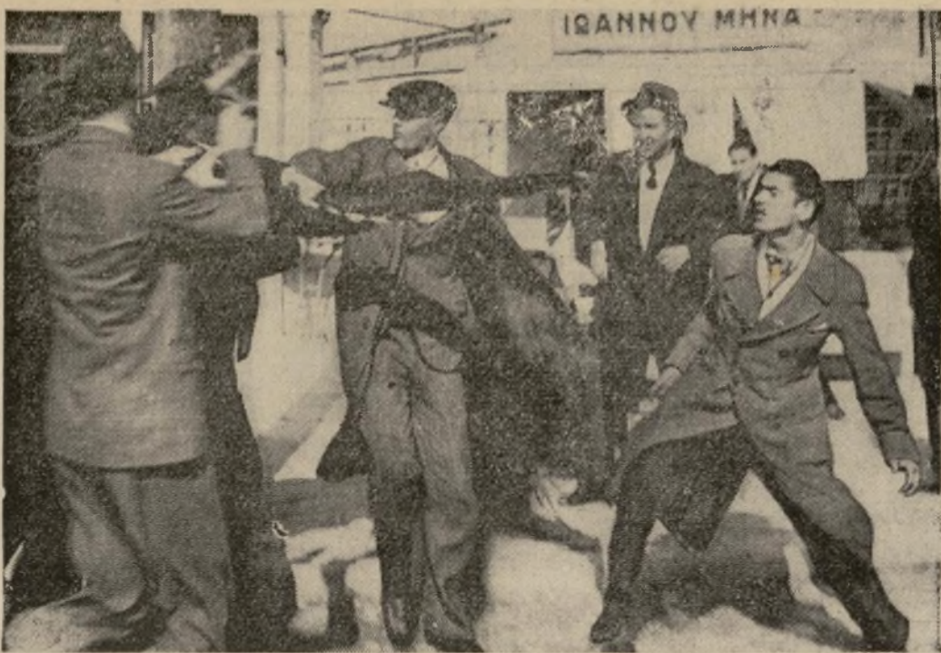
Un policía y un grupo de manifestantes luchan por la posesión de una bandera en las calles del Pireo, el puerto de Atenas, durante un mitin realizado para protestar contra la supuesta agresión italiana en las islas Dodecanesas.