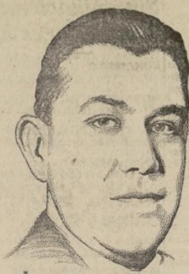
Primer "coach" de basketball de la N. Y. U.