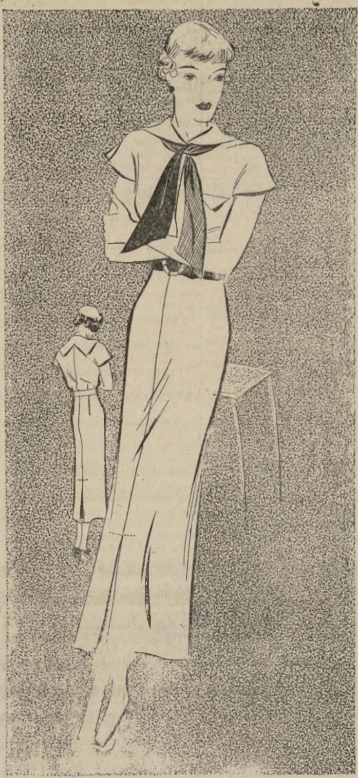
NUEVO ESTILO DE VESTIDO MARINO

1602-B.—Para completar un guardarropa de verano se necesitan varios estilos interesantes de vestidos de algodón, hilo y seda lavable. Ilustra ahora siempre predomina el "chemisier", con el que competirá la nueva interpretación de vestido marino, de líneas angostas y rectas.