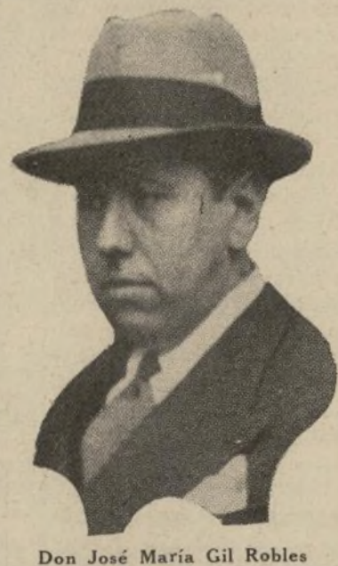
Don José María Gil Robles

"Si no se nos entrega el poder—dijo—estaremos en la obligación de luchar por él. Si no se nos entrega el poder, estaremos en la obligación de luchar por él. Si no se nos entrega el poder, estaremos en la obligación de luchar por él."