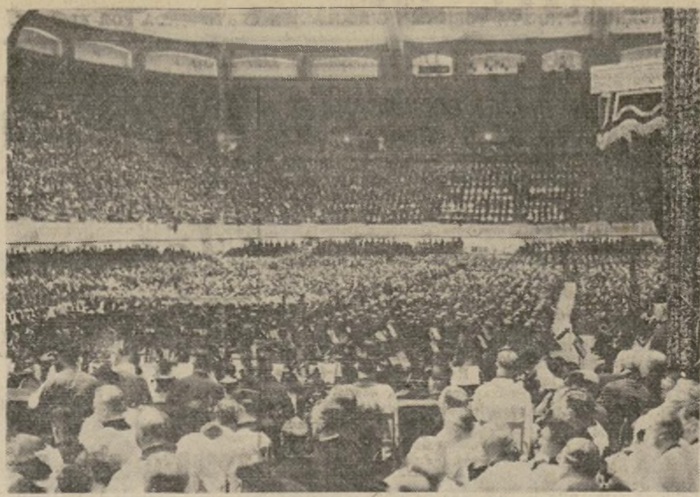
La muchedumbre que llenaba el Convention Hall de Filadelfia cuando el cardenal Dougherty acusó al comunismo de ser el instigador de las leyes promulgadas en Méjico contra el dominio de la iglesia.