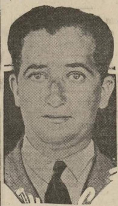
Comandante Ramón Franco

Advirtiendo al empezar que expondría puntos de vista personales, el famoso piloto del "Plus Ultra", comandante Ramón Franco, dió anteanoche en la Sociedad