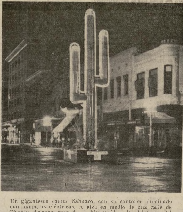
Un gigantesco cactus Sahuaro, con su contorno iluminado por lámparas eléctricas, se alza en medio de una calle de Phoenix, Arizona, para dar la bienvenida a los delegados del este que llegan de visita a la ciudad durante una convención.