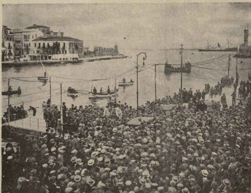
Canva, asiento del movimiento revolucionario y puerto a donde se han dirigido los cinco barcos de guerra que cayeron en manos de los oficiales rebeldes. Las comunicaciones con Creta están interrumpidas. Un avión del gobierno bombardeó, destruyéndola, la residencia de Venizelos en Canva.