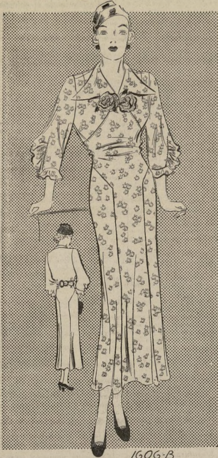
1606-B CREACION PARA MATRONA

1606-B. — Los vestidos de primavera, floreados como los jardines en el verano, están caracterizados con detalles sumamente femeninos. Por ejemplo: las mangas abullonadas, los volantes de las mismas y los fruncidos que luce el modelo que ilustramos.