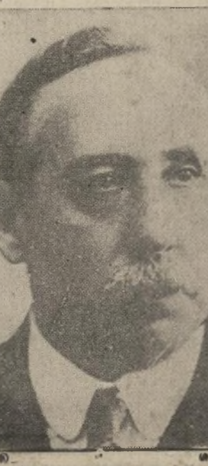
Don Santiago Iglesias