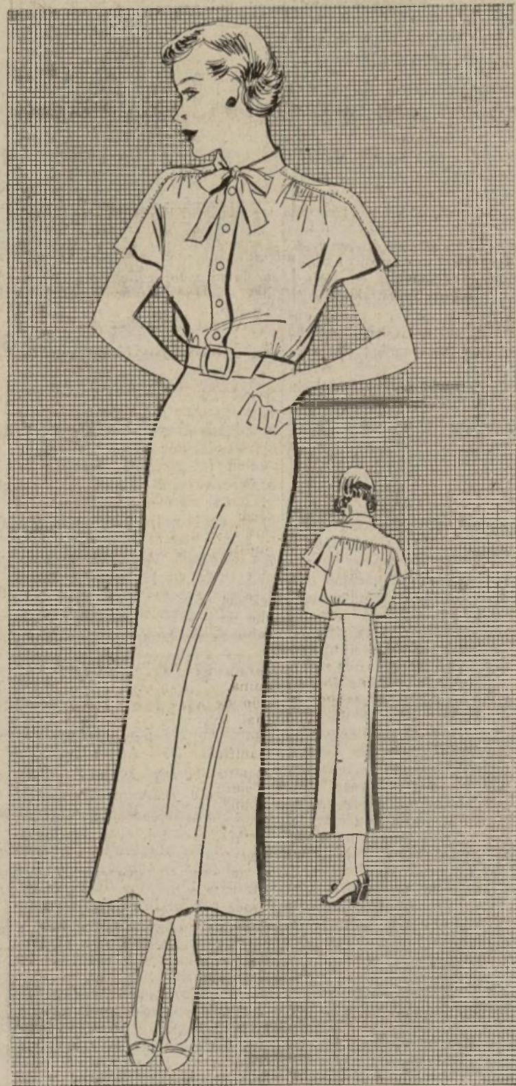
1607-B VESTIDO "CHEMISIER"

1607-B.—Los nuevos modelos de día son más prácticos que nunca. El que ilustramos es de corte sobrio, líneas rectas y se puede confeccionar en hilo, algodón, seda lavable o "shantung". Entre los vestidos más atractivos de esta próxima temporada se notará el cuello alto, mangas abullonadas, la cintura normal y el vuelo de la falda bastante confortable para poder usarlo en cualquier deporte de día, ciudad, oficina o casa.