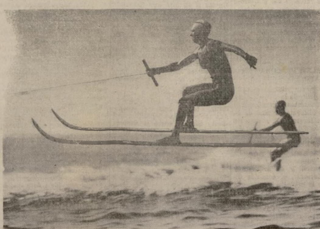
Una joven francesa desfilase velozmente a través del agua en esquíes acuáticos, remolcada por una lancha a motor en las aguas del lago de Annecy, uno de los favoritos de los turistas de Ginebra y de la zona del sur de Francia.