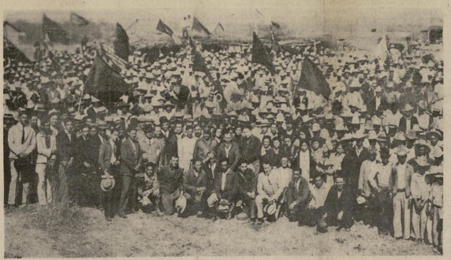
Parte de la muchedumbre de 5,000 mejicanos que se reunieron en Matamoros para las ceremonias de la división de la hacienda "Las Rucias" entre los agraristas que se habían instalado en ella. El caso puede ser que vaya a la corte suprema de Méjico por el hecho de que los dueños estadounidenses de "Las Rucias," que residen en Brownsville, Texas, han entablado acción legal contra la decisión del estado de Tamaulipas, que fué quien ordenó la división.