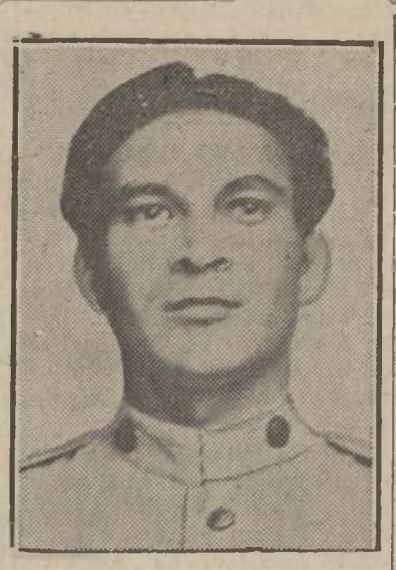
Coronel Fulgencio Batista

Médicos, enfermeras, internos y empleados abandonan los hospitales. Los empleados del acueducto en huelga.—Todas las alcaбалas de la Habana vigiladas.—Ningún líder apoya a Mendieta.—Es posible que se establezca dictadura militar.