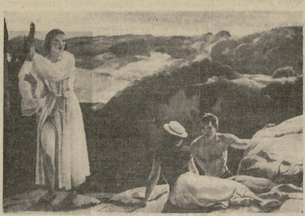
"Cape Ann," cuadro pintado por Leon Kroll, N.A., que recibió el premio Altman de mil dólares, dado al mejor paisaje de una ciudadano estadounidense nativo de este país, en la centésima exposición anual de la Academia Nacional de Diseño en Nueva York

UNO DE LOS CUADROS PREMIADOS EN LA ACADEMIA NACIONAL