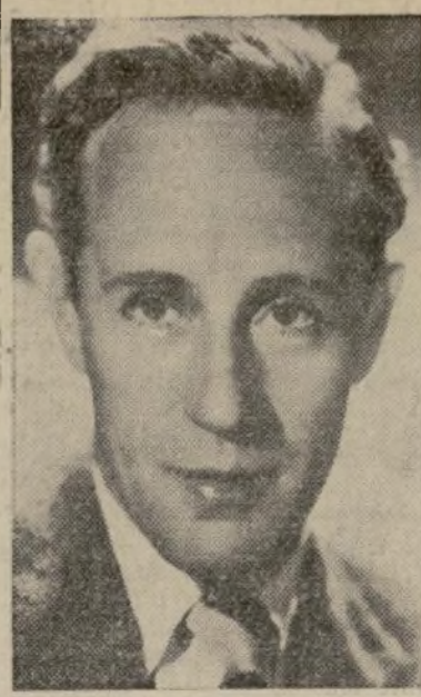
Conocido actor de la pantalla y una de las glorias del arte cinematográfico moderno que aparece en la película "The Scarlet Pimpernel" que se exhibe en los teatros Regent y Hamilton, ambos de la R.K.O.