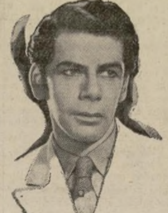
Paul Muni ha creado, con gran propiedad un nuevo carácter en la pantalla. Aparece en la película "Bordertown" que se empieza a exhibir mañana en el Regun en el papel de "Johnny Ramirez," descendiente de una familia mejicana. Muni se destaca como un actor de energía y de gran habilidad.

obra de sangre y revolución. La segunda por el conocido actor Chester Morris.