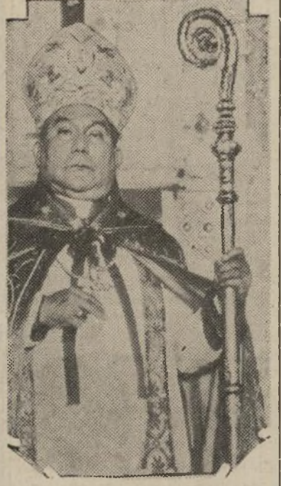
Arzobispo Pascual Díaz

MEJICO, D. F., marzo 8. (AP).—Después de permanecer incomunicado durante cerca de 24 horas, el arzobispo Pascual Díaz fue puesto en libertad hoy en la tar-