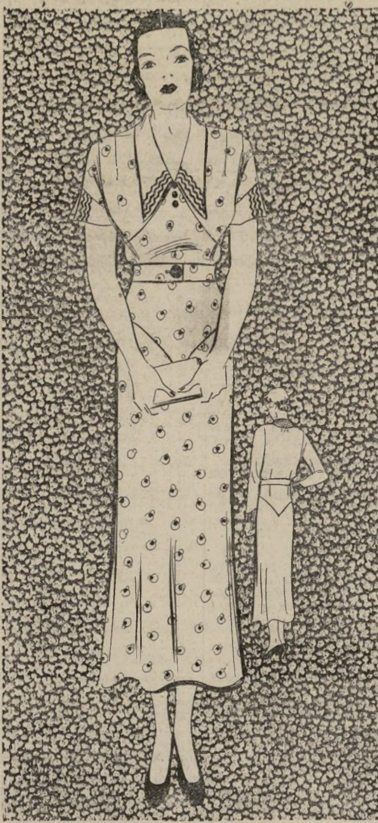
VESTIDO DE CASA PRACTICO

1409-B.—El diseño que ilustra hoy es muy apropiado para el vestido de casa. Como todos los modelos de casa, es de líneas suaves y sencillas, para hacer más fácil el lavado y planchado. La parte posterior se compone de dos piezas y la delantera en tres. Las pinzas de la cintura lo entrelazan graciosamente a la figura, y las de los hombros le dan la soltura necesaria en vestidos de esta índole. La falda es algo acampanada hacia el ruedo. El cuello y puños que adornan este modelo se ven en muchos de los vestidos de esta próxima estación. Los que luce este son de organdi y adornados con rick-rack. Si el vestido es de color sólido puede usarse el rick-rack de diferente color en cada lista, pero de lo contrario se verá más bonito con el mismo en un solo color. Este naturalmente tiene que armonizar con el color del diseño del traje.