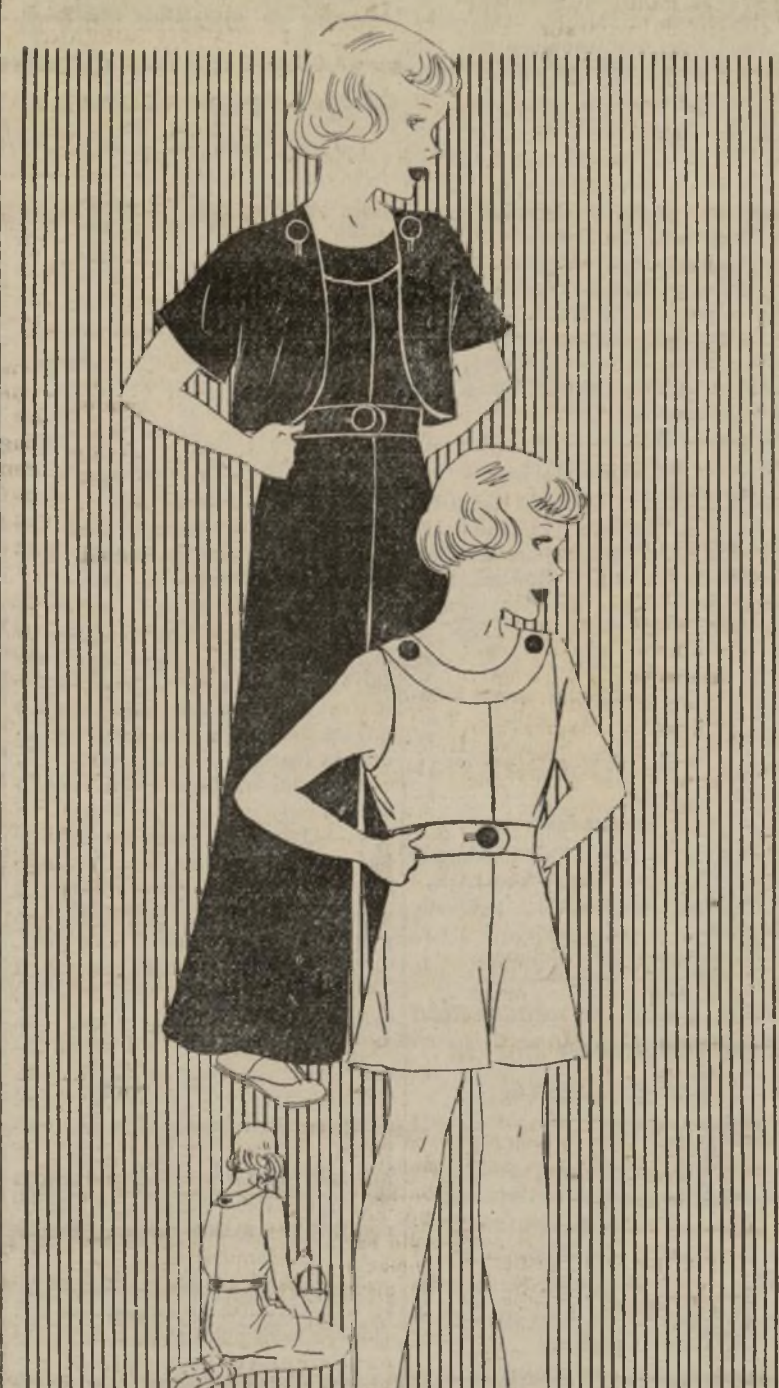
LINDO MODELO DE ALGODÓN O LANA PARA NIÑA