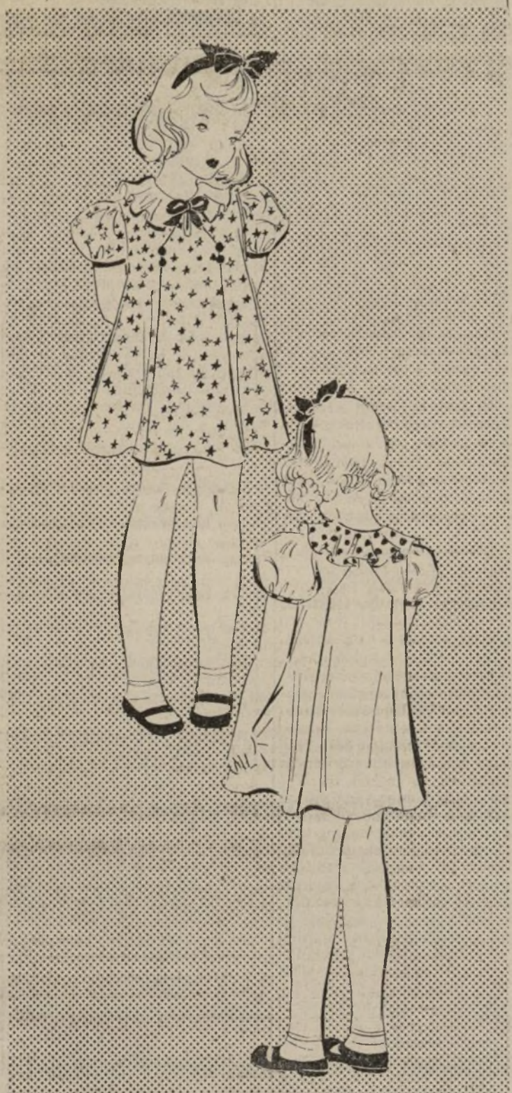
ENCANTADOR MODELITO PARA NIÑA

GRAY'S DRUG STORE Broadway y 43rd St. Atendemos órdenes por correo.