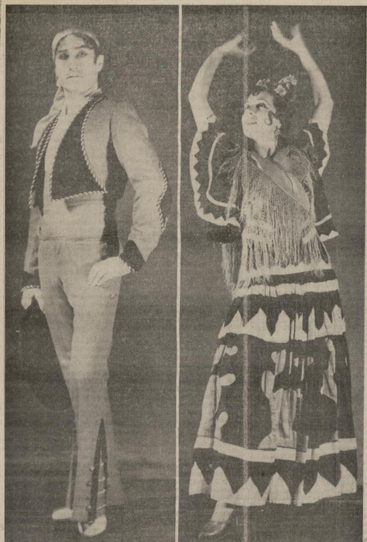
El magnífico bailarín español que, esta semana, se presenta interpretando los baillares de "El Amor Brujo" de Falla en el Radio City Music Hall, cuyo cuerpo de baile ha sido puesto entramente bajo su dirección. Con Escudero, como en el resto de Estados Unidos, aparecerá la bailarina "Carmita" que tanta admiración y aplausos ha ganado entre el público americano por sus interpretaciones flamencas.