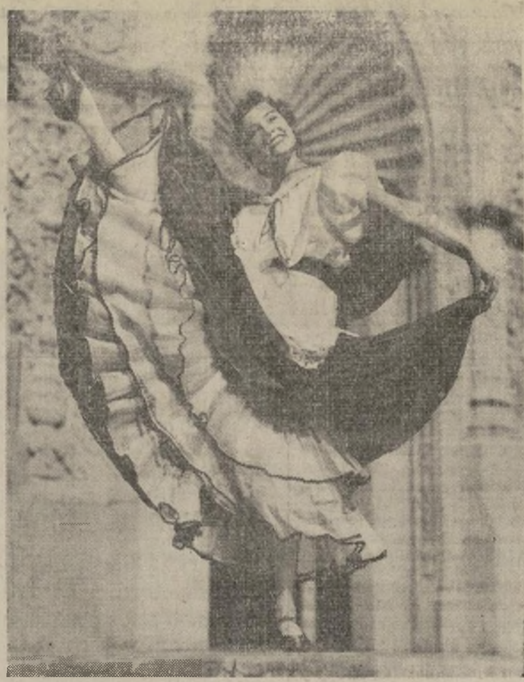
Esta preciosidad que apunta su diminuto pie a las alturas y nos muestra tan provocativos labios, es la bailarina Anita Camargo, que tomará parte en la dedicación de la Villa Española en la Exposición Internacional de California que se inaugurará en San Diego el 29 de mayo.