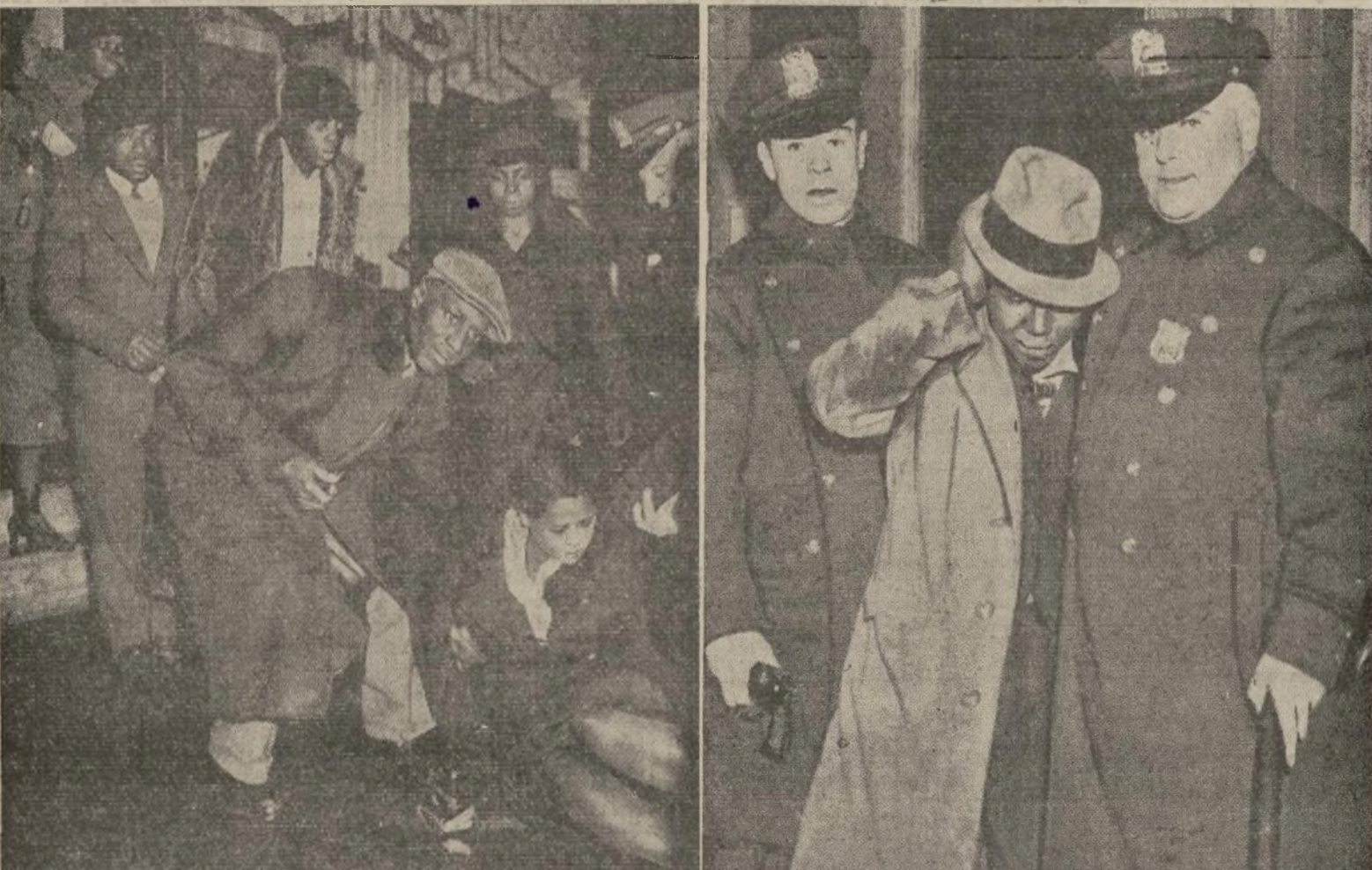
Arriba izquierda, cómo quedó el establecimiento del número 333 Lenox Avenue después de la acción de los amotinados; derecha, la policía buscando armas en las personas de transeúntes; círculo, reportero gráfico herido de una pedrada. Centro, establecimiento de la policía en la avenida Lenox, en la zona de la furia del populacho. Abajo, izquierda, mujer de la raza de color herida al ser atropellada por multitud en fuga. Abajo, derecha, individuo arrestado en el acto de saquear una tienda apedreada. No son sino algunos de los aspectos de la obra destructora de una muchedumbre incitada con falsos informes. Lino Rivera, el supuesto "tiránido", no tenía ni un rasguño y dormía tranquilamente en su casa.