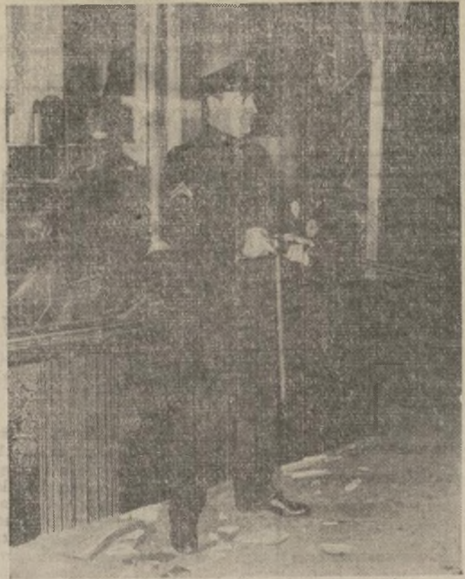
Policía armado con un rifle frente a uno de los establecimientos cuyos escaparates resultaron rotos en el motín que se suscitara en Harlem después de haber corrido la voz de que un muchacho de color había sido linchado en la tienda Kress Co., de la calle 125.