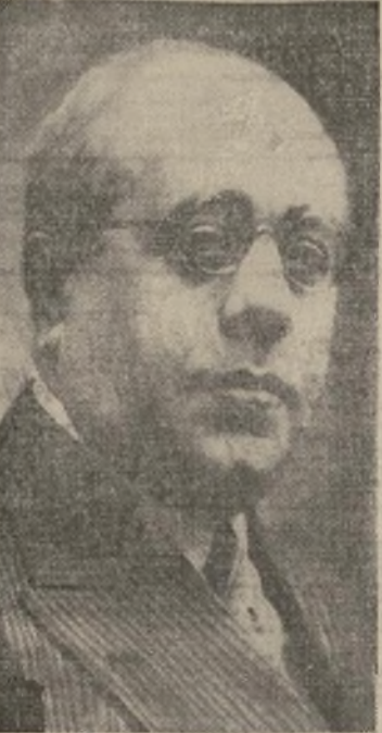
Don Manuel Azaña