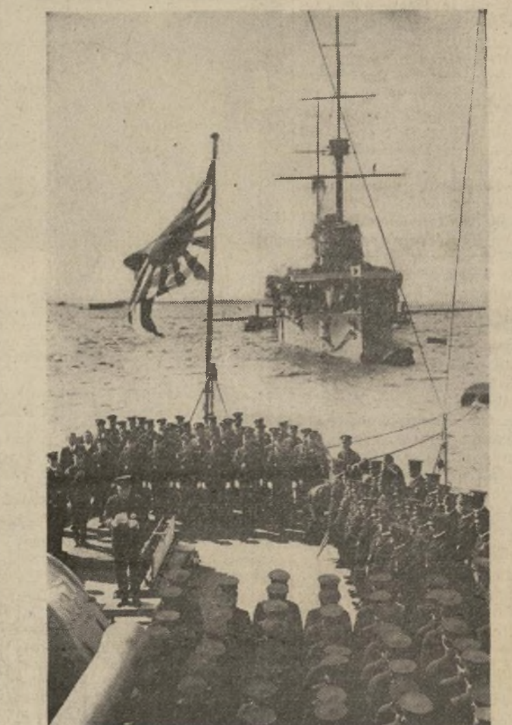
El almirante Mineo Osumi, ministro de Marina del Japón, lee a los guardiamarinas que salen en viaje de entrenamiento de 20,000 millas, el mensaje imperial a bordo del buque almirante “Asama,” poco antes de la partida.

El ministro de Guerra francés habla ante la diputación de movilización hacia ‘puntos estratégicos’. — Alemania fusila espías, acumula alimentos y fabrica febrilmente material de guerra. — Francia no se propone reconocer la violación del tratado de Versalles.