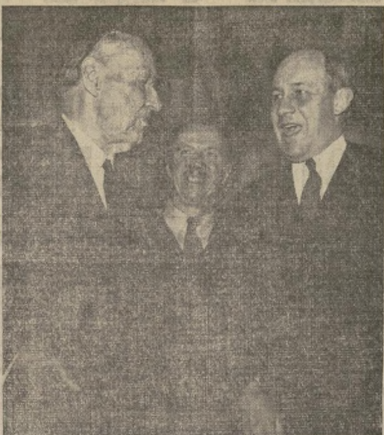
El veterano Clarence Darrow, abogado y economista (izquierda) habla con Donald Richberg, presidente del Consejo Nacional de Emergencia, después de la audiencia del Comité de Finanzas del Senado en la que Darrow censuró el proyecto de prorrogar la NRA por dos años más.