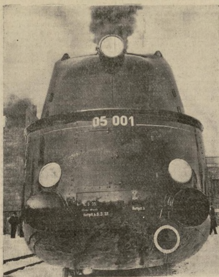
La locomotora de la izquierda, primera de líneas aeroformes construida en Alemania, que se espera correrá a una velocidad de 150 kilómetros por hora, con un máximo de 175 kilómetros. A la izquierda aparece la "Henry VIII" construida por los ingleses para superar el actual record ferroviario de velocidad del Great Western Railway en la fecha del centenario de esa empresa, en los momentos de regresar a los talleres de Swindon después de su primera prueba sobre los rieles.

LOS TRENES EUROPEOS ADOPTRAN LINEAS AEROFORMES