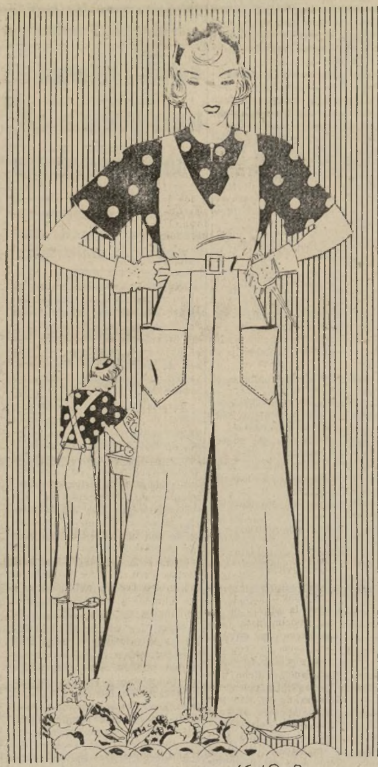
COMBINACION DE ZARZUELLAS Y BLUSA