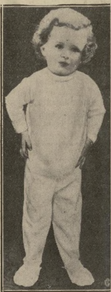
Asegúrese que está vivo en un asilo de Detroit