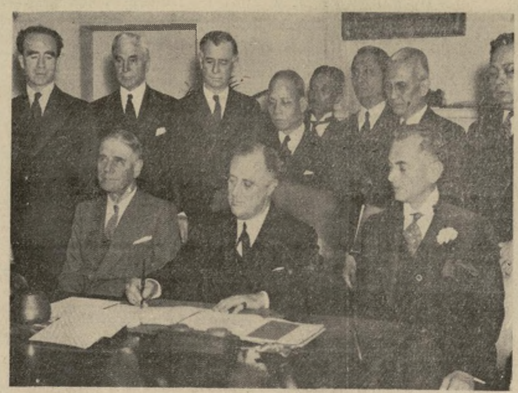
El presidente Roosevelt firma en Washington la Constitución del nuevo gobierno de las Filipinas, dando con esto comienzo al programa de diez años que conducirá a las islas a la república independiente. A la derecha del presidente está el secretario de Guerra, Dern; a su izquierda, Manuel Quenzón, presidente del Senado de las Filipinas. Los que están de pie son otros funcionarios de los Estados Unidos y de las islas.