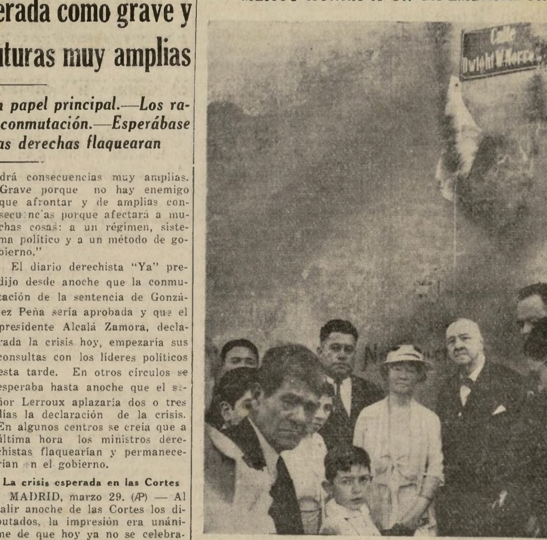
Mrs. Dwight W. Morrow, viuda del exembajador de los Estados Unidos en Méjico, durante la ceremonia del cambio de nombre a una calle de Cuernavaca en donde los Morrow vivieron durante su estadía en Méjico. Con ella está Josephus Daniels, actual embajador de los Estados Unidos.

Enmiendas a la ley electoral atacadas de ciudadanía para votar en Colombia