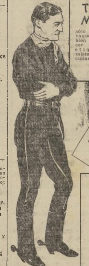
(Copyright, 1935, by The Bell Syndicate, Inc.)