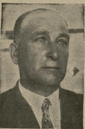
Don Francisco Largo Caballero

MADRID, abril 3. (AP).—El líder del partido socialista, don Francisco Largo Caballero, ha declarado hoy que la minoría de su partido presentará en breve una proposición en la Cámara pidiendo la aplicación del artículo 81 constitucional, que se refiere a la disolución del Parlamento por el jefe del ejecutivo. Por ese artículo, recordó el señor Largo Caballero, el Parlamento tiene facultades para declarar que una disolución de Cortes decretada por el presidente de la República es ilegal. Según el caudillo socialista, su partido acusaría al presidente Alcalá Zamora de incompetencia e incompetencia en el desempeño de su cargo, solicitando su censura. Hasta ahora desconoce la actitud que asumirá el presidente del Consejo, señor Azáña, ante tal emergencia, pero los elementos más conservadores del frente político de izquierdas se oponen a que se provoque tan sensacional y difícil cambio en el momento presente.