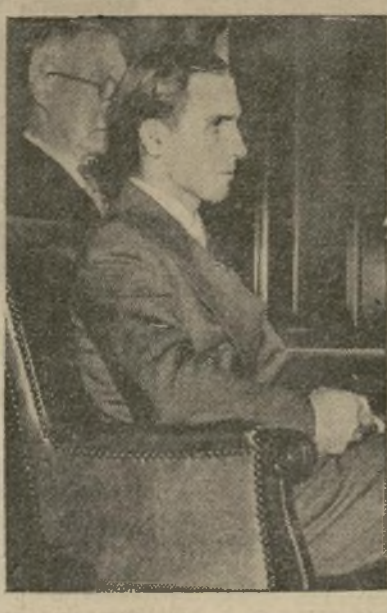
Bruno Richard Hauptmann