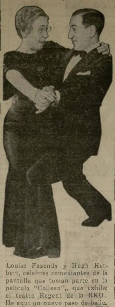
Louise Fazenda y Hugh Herbert, célebres comediantes de la pantalla que toman parte en la película "Colleen", que exhibe el teatro Regent de la RKO. He aquí un nuevo paso de baile.