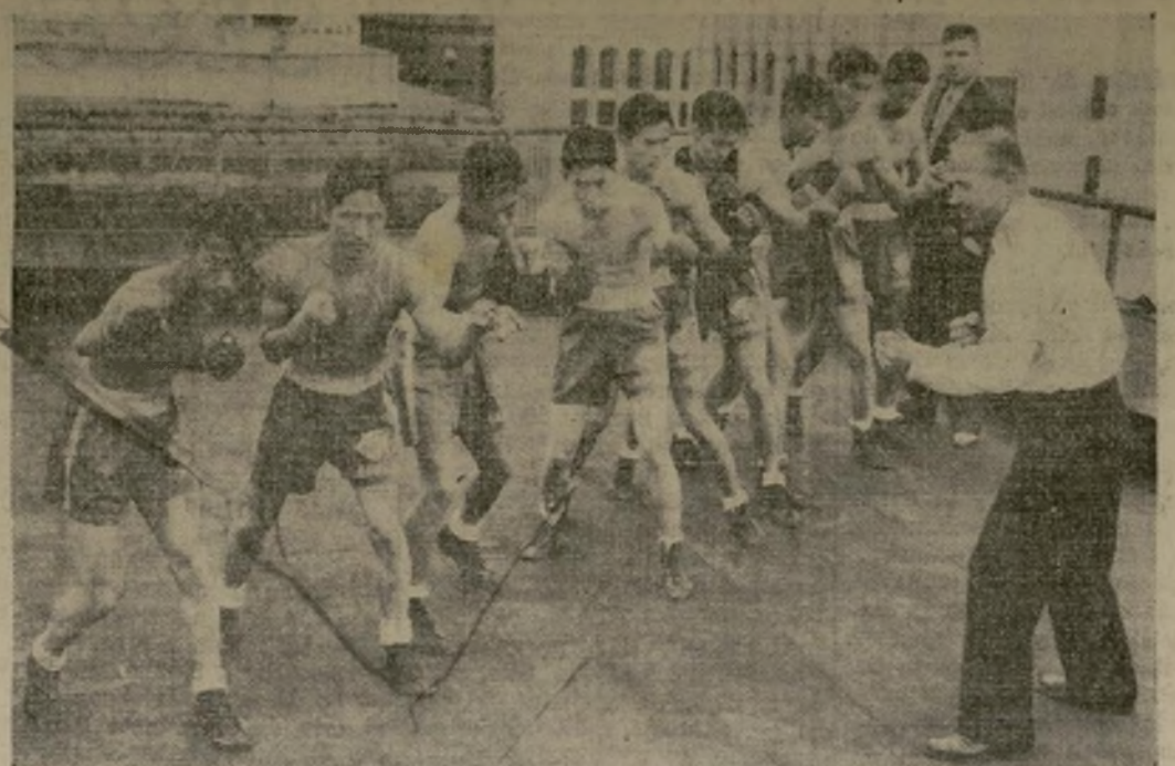
El equipo de boxeo que representará a Hawaii en la disputa de los campeonatos nacionales "amateur", que comenzará el miércoles de la semana entrante en Cleveland, Ohio, con representaciones de prácticamente todos los Estados y posesiones territoriales de la Unión. Su "coach" y entrenador aparece enseñando los "puntos" del arte de la esgrima de los puños.