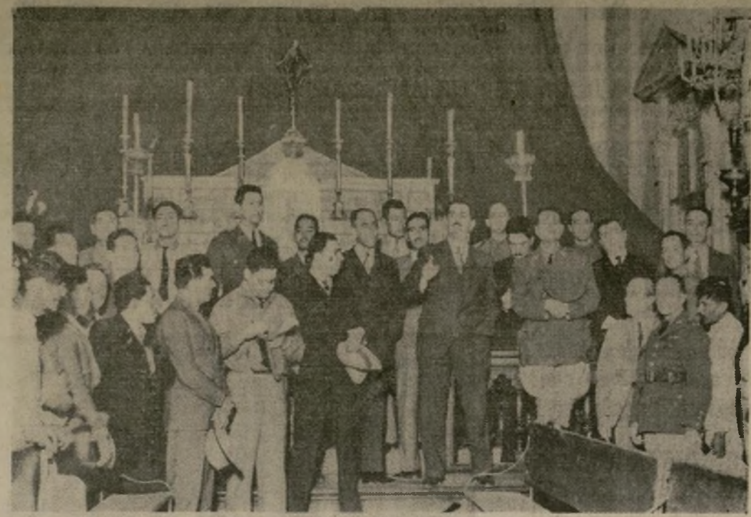
El primer mandatario mejicano dirigiéndose a la prensa y a los agraristas en la iglesia de San Felipe, Torres Mochas, Guanajuato, en donde poco tiempo antes 15 personas habían sido muertas en un tumulto con motivo de las misiones culturales que recorren la República.