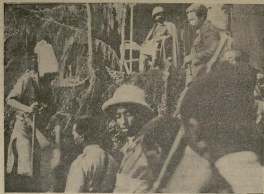
Haile Selassie, desde una tienda de campaña oculta de la vista de los aeroplanos italianos de bombardeo que han hecho una serie de ataques devastadores en su territorio, recibe informes sobre el progreso de la batalla. El gobierno etíope ha acusado a los aeroplanos italianos de usar un producto químico líquido que ha causado muchas víctimas.

EL EMPERADOR ETIOPE OBSERVANDO UNA BATALLA