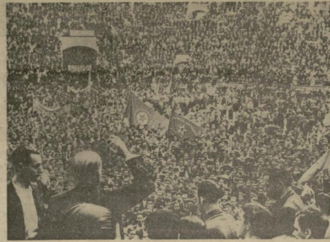
Enorme multitud congregada en la Plaza de Toros de Madrid, para oír al leader socialista señor Largo Caballero, que aparece en la fotografía en un momento emocionante de su discurso de protesta contra la actuación del gobierno.