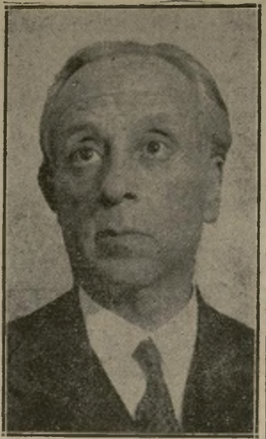
Don Alvaro Albornoz

Los socialistas desisten, al parecer, de imponer uno de sus partidos. — Largo Caballero y Azáña, sostienen a Albornoz. — El gobierno satisfecho de la situación del país.