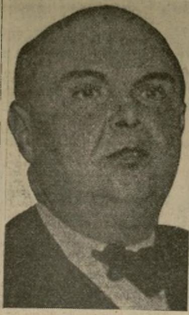
D. Mariano Ruiz Funes, Ministro de Agricultura

Martínez Barrio volverá a presidir las Cortes de nuevo