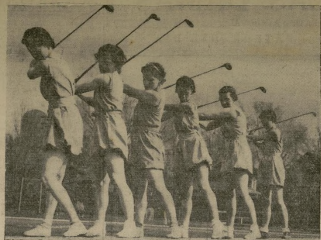
Estas coeducandas del Michigan Normal College de Ypsilanti, uno de los principales centros de educación física de los Estados Unidos, aprovechan el tiempo primaveral para mejorar aun su "forma" atlética, si es que esto es posible...