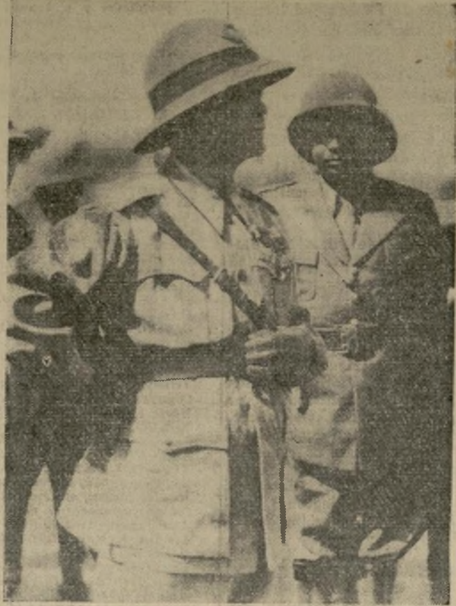
El mariscal Pietro Badoglio (izquierda), el cual entró triunfante a la capital etíope a la cabeza de 30,000 soldados, después de que el emperador Haile Selassie había huido y los nativos habían saqueado la ciudad y atacado las Legaciones de naciones extranjeras.

La 'United Piece Dye Works' cerrará su taller en N. J.