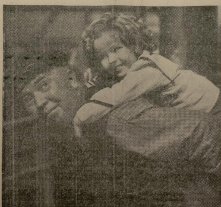
Shirley Temple, la bella niña de los bucles de oro, el conocido comediante Guy Kibbee quienes aparecen juntos en la película "Captain January" que presenta desde hoy el teatro Regent de la RKO.