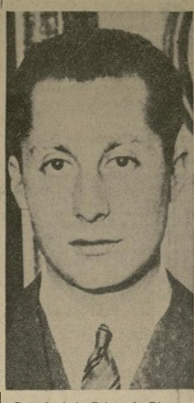
Don José A. Primo de Rivera